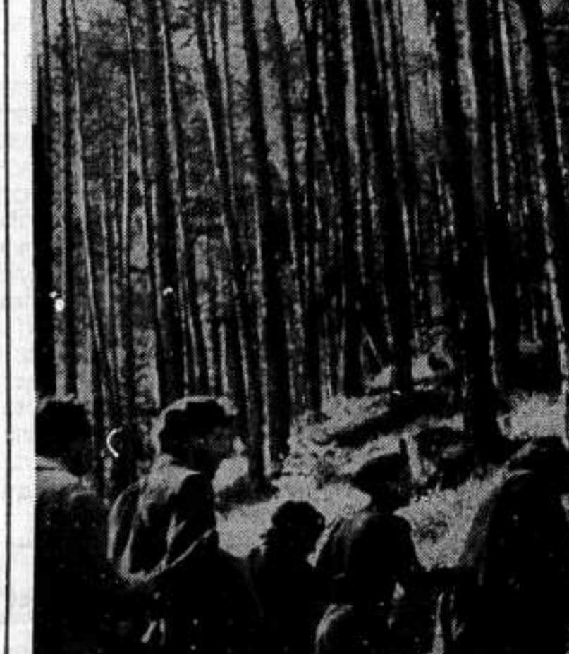
ימי הבחינה באיזופה: פגישה ראשונה עם העולם היהודי ששוד