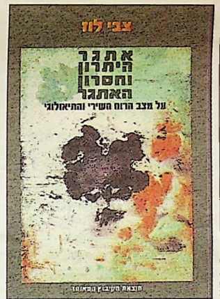
אתגר היתרון וחסרון האתגר - על מצב הרוח השירי והתיאולוגי צבי לוז הקיבוץ המאוחד, 2008, 128 עמ'

רוח הפזמון' משתלטת על ההווה הישראלית. בספר מסכם כואב צבי לוז את הבינוניות ושואף אל הגבוה והנשגב, בניגוד לניסיון ביטול ההיררכיות הפוסט-מודרני