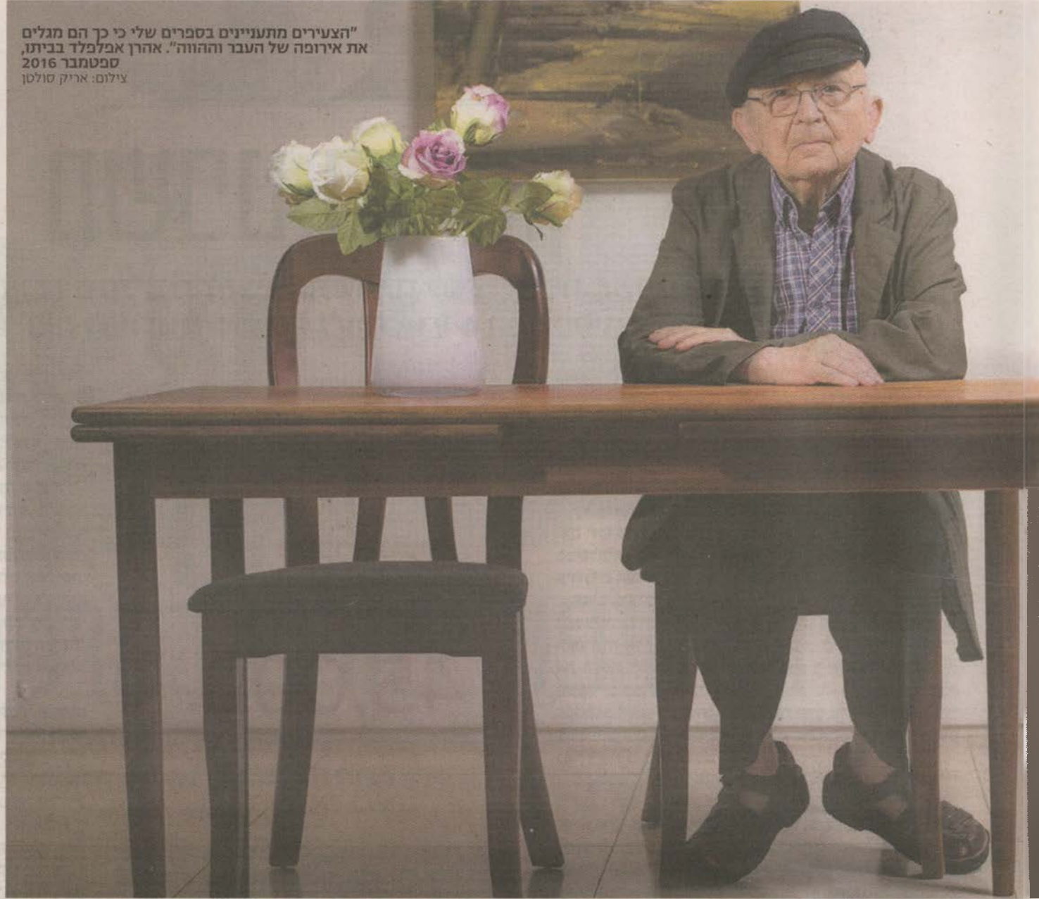
"הצעירים מתעניינים בספרים שלי כי כך הם מגלים את אירופה של העבר וההווה". אהרן אפלפלד בביתו, ספטמבר 2016

"אני לא בעד אחריות: אני בעד קפקא, תומאס מאן ושניצלר, שהם הסופרים שקראו הודי. אך אני באותה מידה קשוב לאבן גבירול, ליהודה הלוי ולשמואל הנגיד. הם נמצאים בספרייה שלי. הייתי הרבה מאוד שנים מודה בתיכון ערב, בסמינר, באוניברסיטה, וכן, מלמדים עד היום בעיקר יצירות מערביות. אבל אני לימדתי הרבה שנים את הפואטיקה של התנ"ך. יהדות ערב וספרד שימרה את התנ"ך יותר מיהדות מערב המתבוללת".