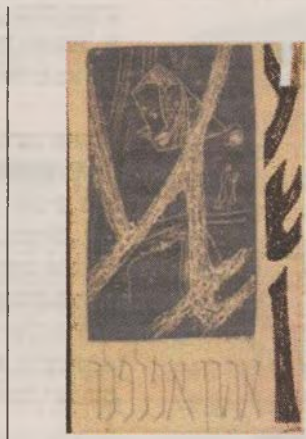
הספר הראשון, "עשן", שפורסם ב-1962