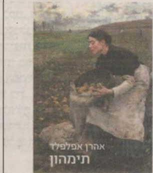
הרומן האחרון, "תימהון", משנת 2017