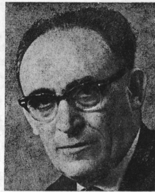
ח'תן פרס-ביאליק תשל"ג פרופ. י. תשבי

עד שלא יצא במהדורה מדעית מתוקנת, מלווה מבוא הסטורי ובאור פילולוגי, יהיה מוטל לפני המשכיל היהודי, שהתרגל לשיטת לימוד שונה מזו המסורתית, כאבן שאין לה הופכין. מכאן הרגשות הטראגית כי בכל ארון הספרים הגדול והעמוס לעייפה שהנחילה יהדות של אלפי שנים אי-אפשר היה לו בזמנו להצביע אפילו על ספר אחד שמשכיל יהודי בן הדור החדש יכול לפתוח וללמוד ללא הרגשה של זרות. רק "חכמת-ישראל" תוכל לשנות את המצב הזה. אבל מצד שני הכיר ח"ג ביאליק מקרוב את חולשתה של "חכמת ישראל" בדורו, שאין בה כוח יצירה, ואת סכנת הכמישה היוצאת ממנה. היא צוברת תלי תלים של ידיעות, עיקר וטפל יחדיו, ללא ענין חי וללא זיקה אל היצירה המתחדשת. חטאה הקדמון של "חכמת שראל" היה בעיניו חטא בגידתה בלשון העברית. מחקר בלשון תרגום היה לדידו נטילתה של מורשת מרשות יורשיה, העשויים להפרותה ולהמשיכה,