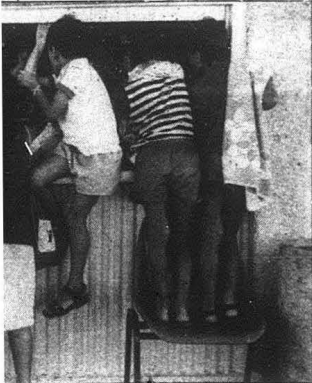
(Caption text partially obscured)

בתוך מציר המספר קווי מתאר כלליים של נופים היסטוריים; ביינו מותו של המלך פייסל ועד לגירושו של חומייני בעיראק, ואת האופן שבו הם מתנגעע כלכל "נורל" גורל ממידת אנוש, גם ממידתם של האנשים האמינים כי כוונה של מתינות אינטלקטו-אלית ליצור סדר הומני כבאוסיות החולכת ומשתלטת על המדינה.