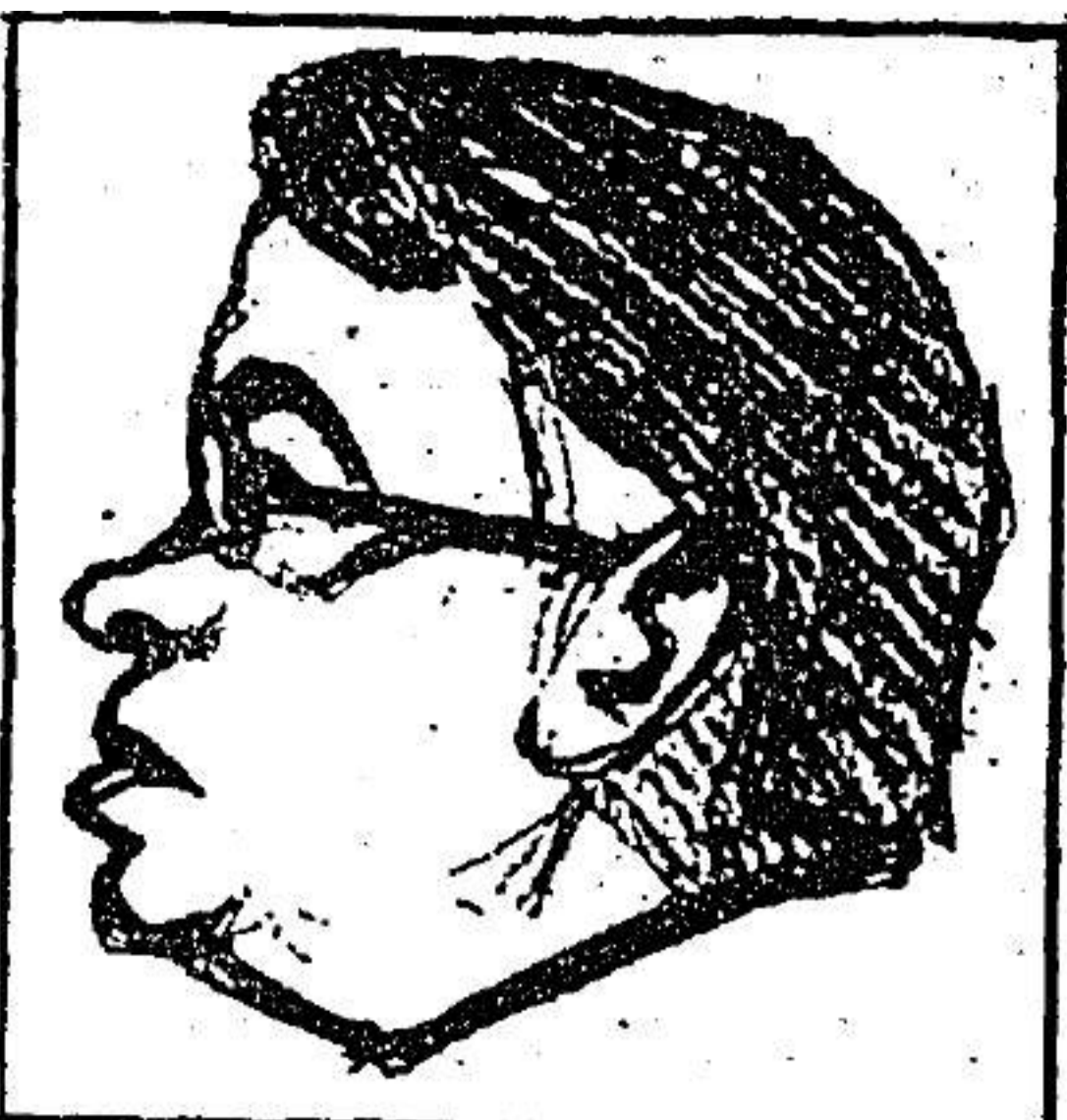
זאב ז'בוטינסקי (רישום עצמי)

אישיות האינטגרלית, שאינה אלא אחת ויחידה, לבין האישיות הדיפרנציאלית, היוצאים מפלני ר באים לאחריו, ואפשר להם ואף כוחם להם, שיחיו אחרים ואפילו רבים, ואם לתגובת התחיה, שיגלומה בהנועת הצינונות ומיבטאה בהסדרות הצינונית, הרי האינטגרל, המסימל בדמותו ויסוד הגותו של הרצל, גשתלשלו הימנו כמה דיפרנציאלים, שהסמל מלכדם, והוא סמל, שלאחר תפוגתה האינטרית של הוסי תרות הצינונית, שכמותה כעילומה, נעשה, כסמל יורשתה, מדינת ישראל, ריקוק הרצל הניבט מעל כותלי בית פתוקקה באין אחר עמו, ולא כן משפטים של הדיפרנציאלים, שדגלם עליהם אתר אינטגרל עצמו, אך נוד-דגלם שונה ואחר, ואפילו מן הקצה אל הקצה, והמלחמה בנייהם, כמלחמת צדדים, שכל צד וגד טוען למלאו ירשתה-האינטגרל, תוכיה. ואפשר כי גם העצרת שלנו עתה, ביהוד רבה-השית, שישמע הערב, יסקף כזה וכזאת. ואודה, כי לולא גורשהי לדברים, כאופיה של הוהכנית לפני הצהרים, ונתבקשתי לדברים, באופיה של הוהכנית הערב, היית משהייע בשפת הכושר, למלא את שהסכרתי ברוב ימים, שכן זולת דברים מעטים, להם גבולם של ציוני-מלוס, מהם ב גבולם של סמפני-הלצה, לא יצאתי יד הובתי כלפי האיש הנפלא הזה, שירטוט ליקונו הסר מגלרית הדמויות שגזתה, כמעט כוחה, הרצל, דברים, והייתי אף מוחה דיני על עצמי, בדרך שכבר מתחתי, בשרטוט דיוקנו של דוד בגוריון, ש שילבתי בו הרהורי-הרטה על שגלמתי כהצעת הד הסכם שבינו לבין ז'בוטינסקי, ואפילו הייתי רא שן המסתערים עליו ב, דברי, ולא השכלתי להבין, כי אילו, אומנם, היה, בימים ההואים ההם, פתח להשקפת האש שאכלה את המתניים, לא היה אולי מעשה ההגלה מאימי הכליה, שארבה להמוני בית ישראל בגולת-אירופה, ואף כילתם, מועט כל כך, והוא חסא שהרגשתו המרה תלווני עד אחריתי.