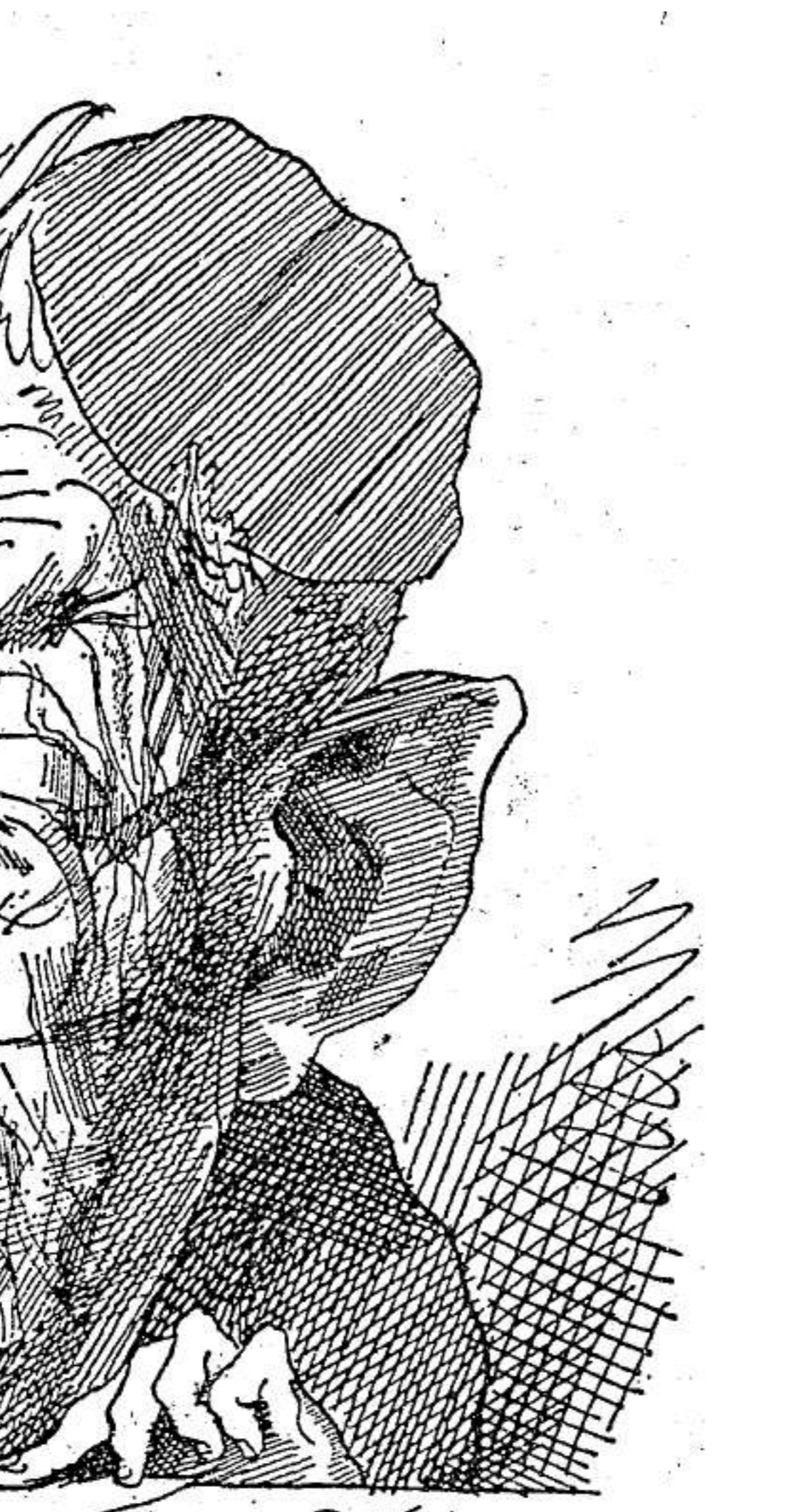
ש"י עגנון, צייר דוד לוי (C)

סימן אחרון: הוודאות האמנותית עשויה כזו ב-אופי, שההשגחה העליונה מלמעלה והביטחה החלוטה בה מלמטה הן כחטיבה אחת, מלוכדה והרמטית, כגו-גנה, מלוא חפפתו, על שניהם, על המספר וחספרו, על המתואר ומתארו. אבל לענין המספר והמתאר, הרי ידענו מסיפורי האחרים, כי מהם אמנם מאותרים