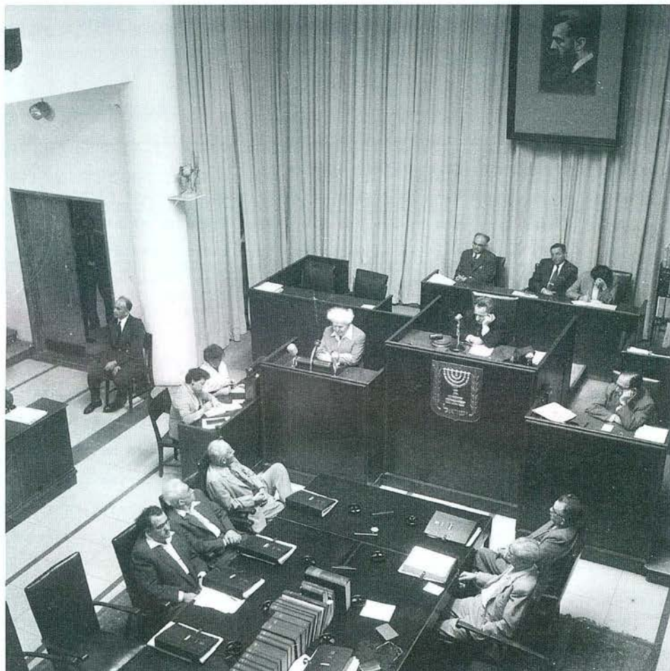
בן-גוריון קורא בכנסת את שירו של אלתרמן, 15 באוקטובר 1956

יצחק בן-צבי לראות את פריקת הנשק לא נענתה. 53 מיכאל ברי-זוהר כתב כי 'מוזר הדבר שהשרים שמעו על הפריקה לאחר שחזה בה משורר, אם כי משורר דגול'. 54 מיד אחרי שצפה בפריקת הנשק – ועוד לפני שנכח בטקס בשדה התעופה הצבאי בחצור – כתב אלתרמן טור שתואר בו מה שראו עיניו בנמל הקישון. הוא מיהר להגישו לראש הממשלה, ששהה במעונו בתל-אביב, וזה כתב ביומנו: 'אתמול הביא לי אלטרמן [כך כתב את שם המשורר] "טור שביעי" שכתב בעקבות נוכחותו בכוא האונייה הנשק הרביעית. טור נהדר, מהטובים ביותר של אלטרמן, אבל אמרתי לו שעליו לגנוז אותו עד עת מצוא'. 55