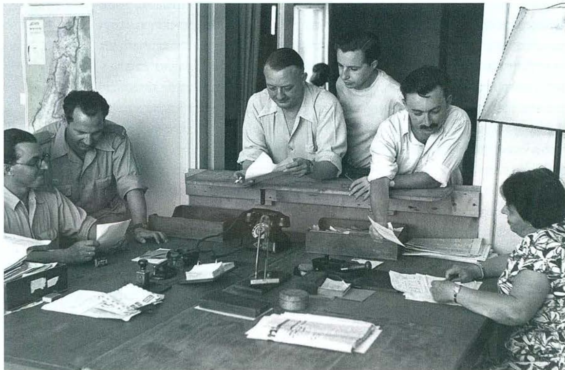
משרדי הצנזורה, יוני 1950

בן-אהרן. חמישה חברים תמכו בהצעה שהייתה מעודנת מזו של ראש הממשלה, ושנאמר בה כי יש בטור 'פסוקים שצריך היה למחוק מטעמי ביטחון'. ראש הממשלה הטיל אפוא את כל כובד משקלו, וועדת בית המחוקקים אישרה את החלטת הצנזור הצבאי הראשי לפסול את הטור שכתב אלתרמן. 27