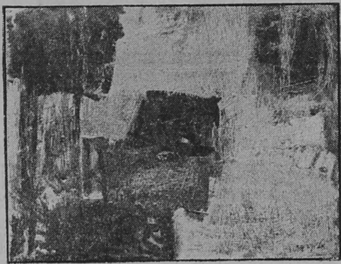
קומפוזיציה (שמן) (ראה מאמר בעמוד ב')

(1) "גזית", כרך א' חוברת ג'. (2) "עכשיו", קובץ 43 עמ' 109-122.