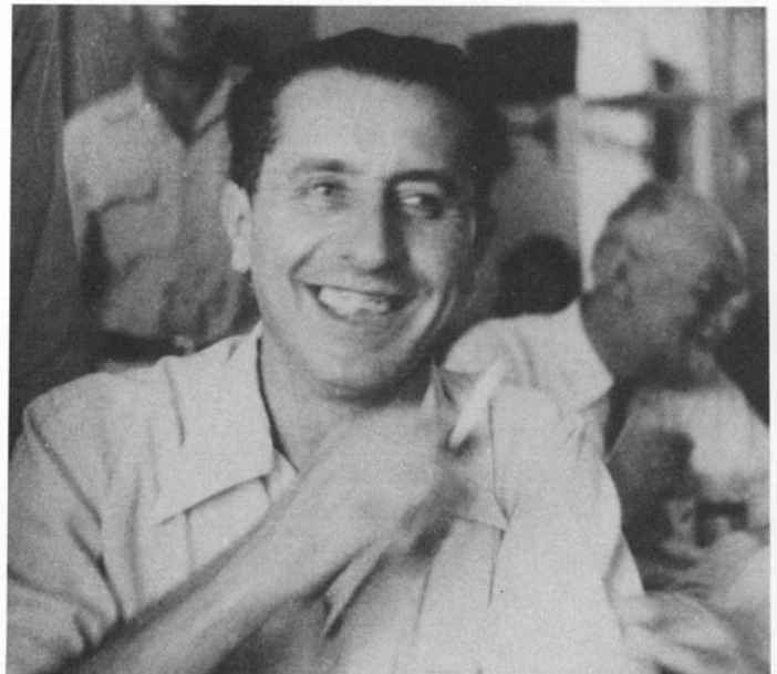
אלתרמן במצב רוח מרומם — שנות ה-40.

בדברים אלה חושפים את דעתו של אלתרמן על הספרות בכלל ובוודאי על הספרות של העתונות היומית. אף כי הדברים נאמרו גלויות בשנים המאוחרות, הם מסבירים את שירת אלתרמן בעתונות, החל ב"דבר" — תוספת ערב", שם