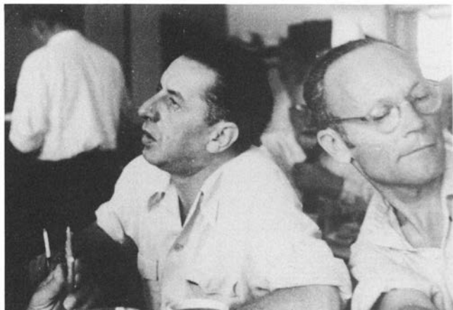
אלתרמן וישראל זמורה, שפירסם בהוצאתו, "מחברות לספרות" את שיריו הרציניים

מבחינת "האומץ והזעם" גמלה תמורה בכתיבתו הציבורית של אלתרמן באפריל 1967, כאשר נטש את טורו ואת מעמדו המיוחד ב"דבר". בעתן זה עבד אלתרמן משנת 1943 [כלומר 23 שנים]. מאז משבר "הפרשה" ובעיקר לאור סילוקי-הסתלקותו [איני מסכימה לעניין "סילוקי" ומסכימה בהחלט לעניין הסתלקותו. – מ.ג.] של דוד בן גוריון מהנהגת המדינה ומצמרו מפלגתו – הלכה והחריפה עמדתו האופוזיציונית הנועזת והבלתי מתפשרת כלפי התנועה והסביבה החברתית, הממסד ואישי ההנהגה, אשר בשנות השיא של כתיבתו הציבורית במסגרת "הטור השביעי" היה הוא דוברם הנעלה והנערץ.