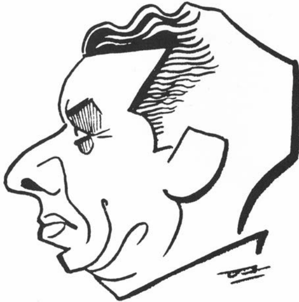
דיוקן של אלתרמן

ולמעשה הוא זר לו. זה מסביר יותר מכל את מעברו ל"מעריב".