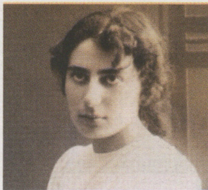
רחל בלובשטיין. ספר לבת מצווה

אבל לא רק שירי חמלה, התבגרות והומור ממלאים את "נשמנות". כאמור, לא פעם הופנ' תה ביקורת כלפי משעול על אי הרצון והנכור' נה לעסוק בפוליטי, על היותה "משוררת פנאי". פה ושם אפנם הבלחיו לשירתה תמוזי נפץ, כמו זה שבשירה "לא היו נפגעים" מ-2014, שעולה השמימה לפגוש ב-72 אתונות, אבל נכון הוא שהיא כמעט תמיד מתרחקת משירה פוליטית. ובכל זאת, יותר מהד למצב מופיע בספר השיר "עטלפים", למשל, מספר על העטלפים הפרוטים בהמוניהם על עצי התאנה והתות בלילות וש' כים בבוקר כרוחות רפאים להסתתר במסג הנ' טוש הסמוך, "צפופים ומצקצקים את סיפורו של בשיט - הכפר הערבי שעל חורבותיו אנו חיים". או השיר ששיכבה בעמוד הסמוך, על "הבום העי' מום", הד נפילת הטיל, ששולח את כלבתה לה' תחבא מתחת לבית "ישום מלים או לשיפות לא ירגיעו על אף כשכושי ההודיה של הזנב הזעי' ניים השחורות שבהן אני משתקפת". משעול, שבעצמה מסבה את תשומת הלב אל השירים הפוליטיים שבקובץ, מתגלה