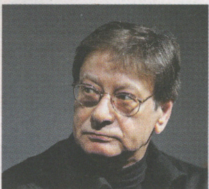
נחמוד דרוויש. סומן פוליטית

כאמביולנטית לנושא. "קראתי פעם ראיון עם מאיר שלו שבו באו אליו בטענות, למה ברומנים שלו אין פוליטיקה. היתה לו תשובה מאוד יפה. הוא אמר: 'כי אני לא רוצה'. בלי לפרש, בלי לה' תגונן, כלום. יש משהו נכון בלהשאיר את המוזה חופשייה, לא רתומה ולא משרתת דברים. יחד