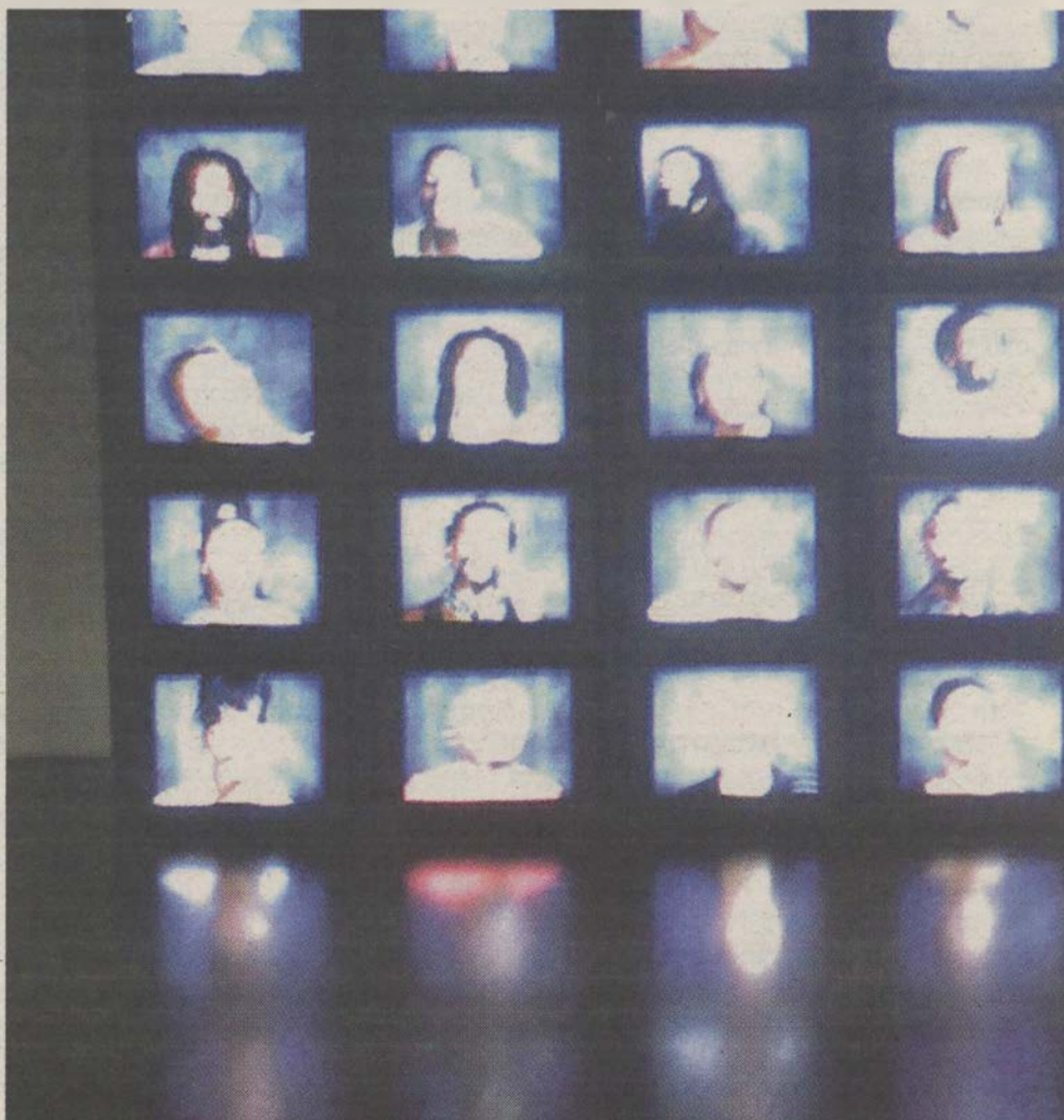
הדימוי הטכנולוגי מנתק עצמו מן התנאים של הקיים, כמעט לועג לממשי

הקושי העצום לייצר אמירה מחודדת על משקל כבד כליכך של התרחשות אנושית מכשיל את מרב הניסיונות. התנועה של בז'רנו נכונה, לשלוף אירוע