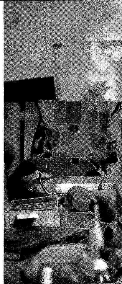
לא רק ציל הילדים

"אני מרגישה את העושר בעולם הזה. שהוא רב צבעים, רב פנים. כשהייתי עם הבת שלי בלידה שלה, ראיתי איך בתוך הילדה העדינה שלי נכנס כוח קמאי כמו דיבוק, ואיך היא מנסה פתאום, למול איתן טבע שמשתולל בתוכה, להתרסן. זה כאילו