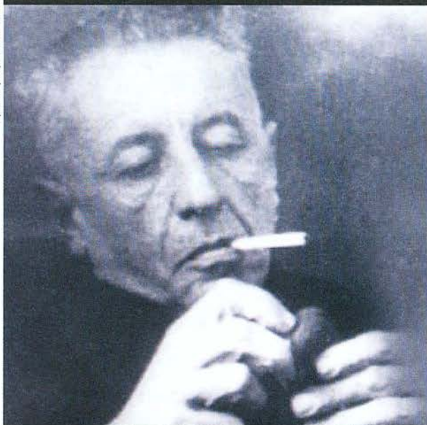
אלתרמן. אי אפשר לדבר בשם המתים

מירון: כאשר כתבתי את מאמרי השבח הראשונים שלי על אבות ישורון, בעודי נער בן עשרים, קרא לי אלתרמן לשיחה והזהיר אותי מפני איבוד שמי הטוב אם אמשיך לעשות זאת, שהרי הציבור מבין שהמדובר במשורר משובש לחלוטין