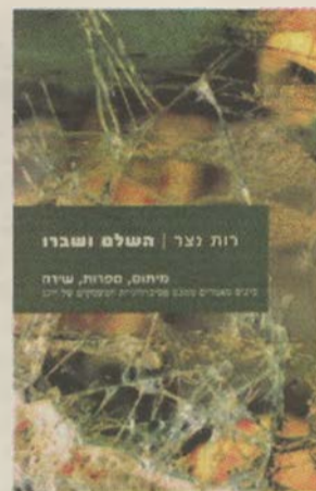
השלם ושברו - מיתוס, ספרות, שירה כינוס מאמרים ממנט פסיכולוגית המעמקים של יונג רות נצר כרמל, תש"ע, 476 עמ'

באוסף מאמרים פרשני עשיר וגדוש שוללת המחברת את היבטיה המנכרים של התרבות המערבית, המכחישים את הקסם והמאגיה שבחיי האדם, ובוחרת לכתוב על יצירות שנותנות ביטוי לחידתיות שבקיום האנושי