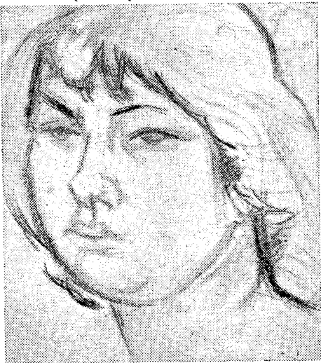
ראש נערה (רשום) יצחק ממבוש

בין בגלל אפיו המיוחד, סיפור העומד בפני עצמו. אולם מבחינת המוטיב המתחם למלחמת השחרור, אפשר לשייך אליו את הסיפור האחרון שבקובץ.