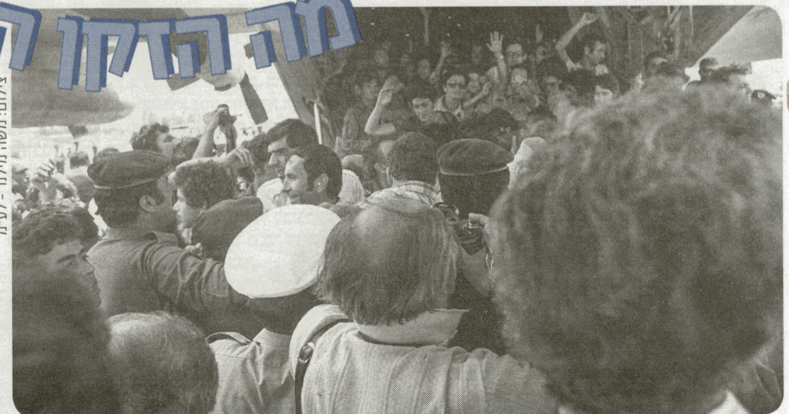
מוטה אמר שזה ג'יימס בונד, זה גולדפינגר. שחרור החטופים מאנטבה