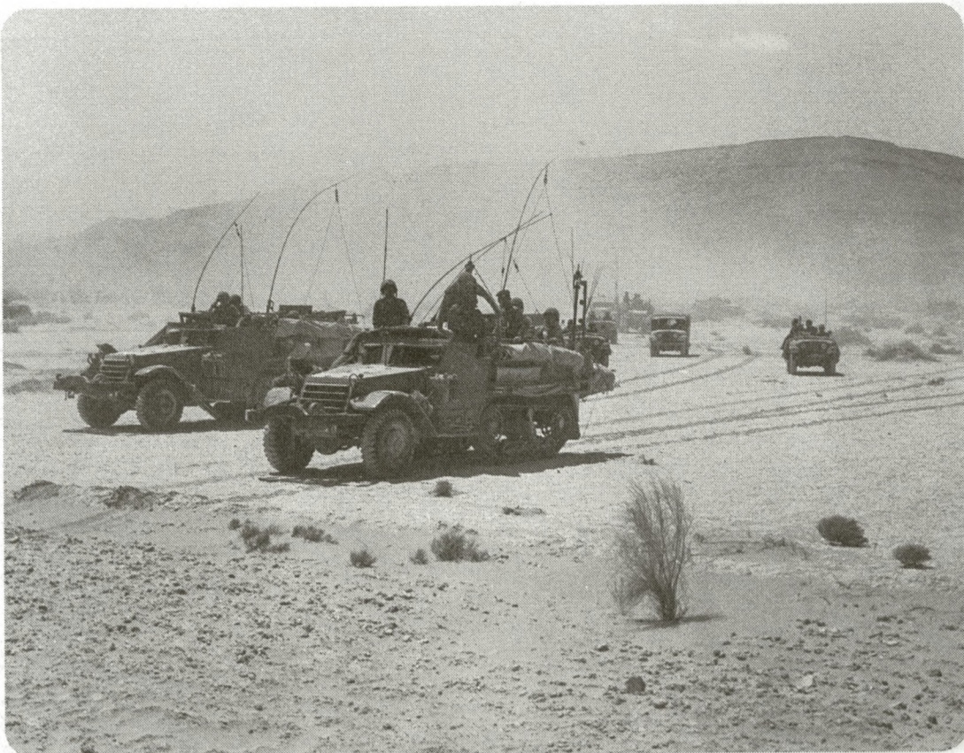
עם המינוי של דיין לשר הביטחון היה כבר הליכה למלחמה. כוחות צה"ל בדרום סיני במלחמת ששת הימים