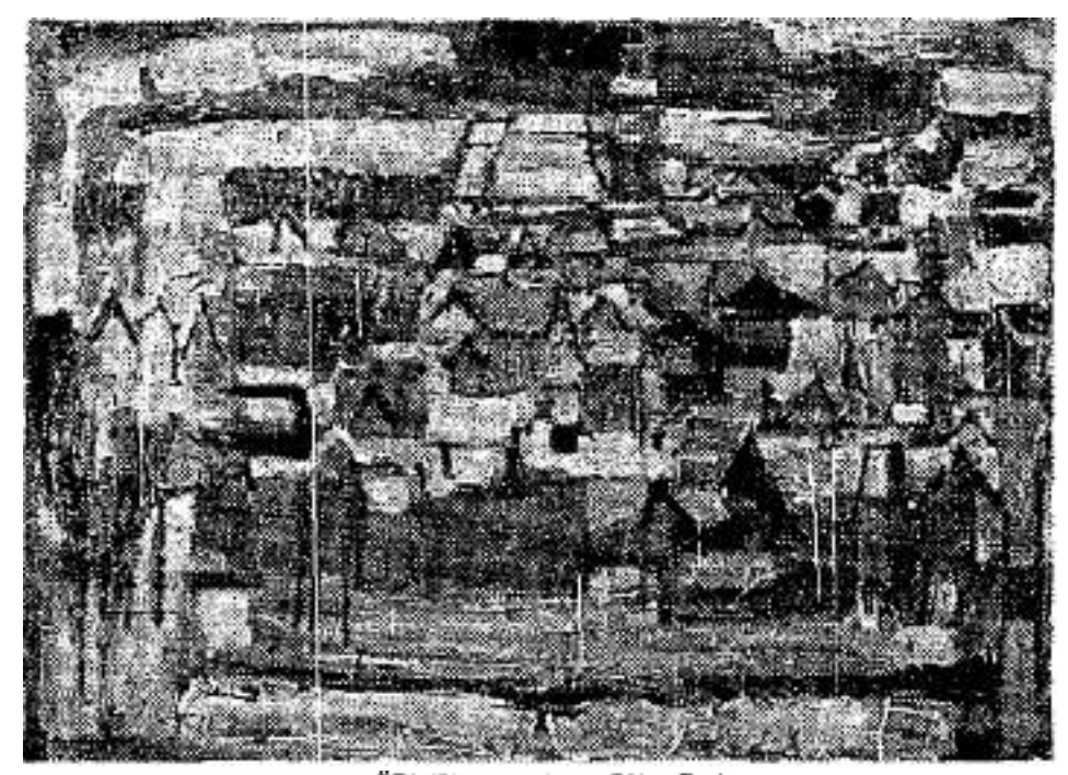
דאס קופרמאן, רודוס (ראה את הרשימה שריק בעמ' 8)

לשוב לבית שני - זהו מה שדרש מאת העם, וזהו מה ששימש לו קול קריאה לתוקרים, חכמת ישראל בדקה וחקרה כל פרט ותג בכל ספרותנו הגלותית, ואילו ימי הבית השני חקרו פת גיבושו של הרעיון המשיחי, מתן אמונה חדשה לגויים, והשתפכות ריחני על פני חצי העולם - תקיפה זו שיהדות ואנושיותה הלכו בה באמת יחדיו, עדיין היא פרשה סתומה, וקלוזנר נרדרש וקיים והקדיש את חייו לחקר תקופה זו שצריכה לשמש לנו מגדרו ועסק הרבה בספרות ימי הביניים, הרי תמיד היתה כוונתו למצוא את הסמוכין הקשרים בינינו וביניהם, ועל כן קסמה לו צמיחת הנצרות בתור חידה מחקרית, יחד עם פירוש היהודי, שלמה אבן גבירול, ברנך שפינוזה - כולם אילנות נטועים אצלנו וגופם נוטה למרחקים, ומצד שני - גם קאנט וטולסטוי, אילנות נטרעים במרחקים ושרשי שרשיהם טמונים איכשהו אצלנו, ועל כן קירב בשערי חזו סופרים צעירים ונתן להם מהלכים בים בקרב הקוראים, וחיבר ספרים, נכסי צאן ברזל, בחקר הספרות העברית החדשה בהם הוא מחפש לא רק את היצירה אלא גם, ובעיקר, את האדם היוצר, נשם שלא יכול היה להתעלם בכמה מקומות במחקריו ממ"תו ביטוי לירי לאדם הפרטי שבו עצמו, גישה זו שלא קיבלה עדיין