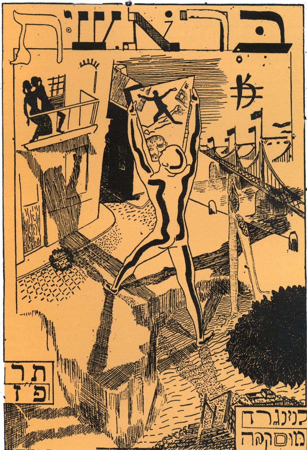
עטיפת "בראשית" ברוח הפוטוריזם והאקספרסיוניזם. הצייר - יוסף צ'קוב