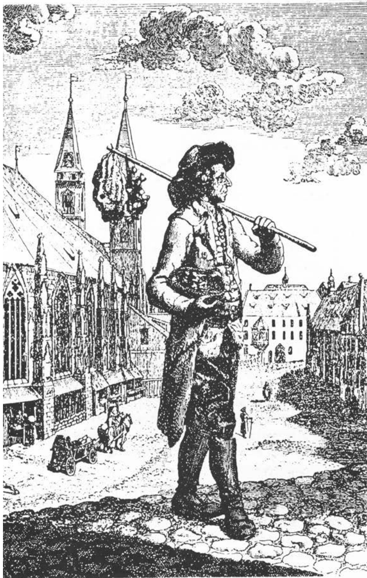
מהווה יהודי גרמניה בעת הופעת "המאסף": מטבע לציון קבלת זכות הבחירה ליהודי הסן (למעלה). רוכל יהודי בבוואריה (למטה)

בתוך כך גולש המשך הדיון שוב לקהל היעד של העתון. העורכים מטעימים, כי ההשכלה היא עניינו של כל אדם בלא להתחשב במעמדו החברתי ובמצבו הכלכלי ("אם בסידרות מלכים תשבו, ואם כאהל רעי אהלכם, אם על מטות שן תשטחו ואם יחד על עפר תשכבון"), ואף בזאת הם צועדים בעקבות העתונים האירופיים שפתחו את שעריהם לבני המעמד הבינוני, והם קוראים לקהלם לבוא ולהצטרף אליהם בהירשם לביטויים העמוסים איזכורי פסוקים ורמזי משמעויות: "קחו מוסר רעים, ואל תטשו תורת אחים". בדרך דומה הם מבטיחים, כי קוראי המנשר ימצאו "חפץ בתורת ה'" ויבחרו "נוח בעדן החכמה". זיהוי כתב העת עם תורת ה' בא לא רק כשיגרת לשון וכמליצה, אלא גם לצורך הנחת דעתם של כל החוגים המסורתיים.