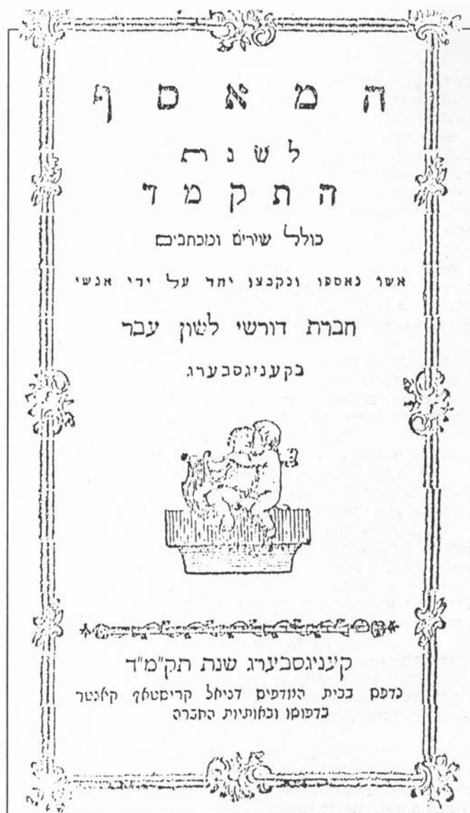
המאסף – שער הגיליון הראשון, תקמ"ד 1784

המנשר כתוב בסגנון מיוחד של פנייה והצגת הנושא תוך הגדרת מהותו של כתב העת. יש בו חגיגות מסוימת בכותרת המשנה, ומורגש ריתמוס של שירה וטון של הכרזה ("בשורה"): "נחל הבשור מבשר טוב, משמיע שלום, לכל משכיל דורש האמת ואוהב המדע בעדת ישראל יהי נועם ה' עליהם מעתה ועד עולם אמן." גם כאן יבחין הקורא המשכיל במיומנותו של המחבר בהכלבת פסוקי ישעיהו (נב, ז), כדלקמן: "מה נאוו על ההרים רגלי מבשר משמיע שלום, מבשר טוב משמיע ישועה" עם נחום (ב, א): "הנה על ההרים רגלי מבשר משמיע שלום." אך למעלה מזה, המחבר השכיל לשוות לדבריו ארשת נבואת נחמה וקריאת עידוד (במקור: על גאולת ירושלים) תוך רמיזה משכילית, שמצאנוה גם במקומות אחרים, שהנאורות האירופית הינה