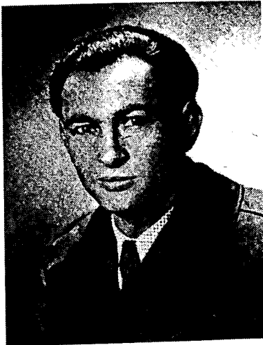
קרובי, מרדכי גולדפרב, ממנהיגי המרד בסוביבור