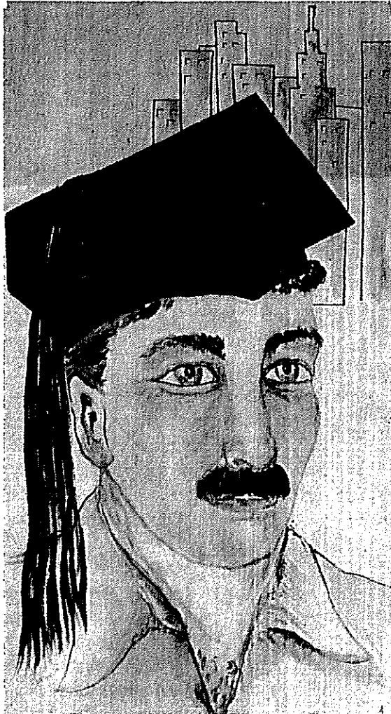
AN ISRAELI STUDENT IN U. S. (Please Turn To Page 12, 13.)

סטודנט ישראלי באמריקה פאת ימיחה ברובאום מדור לצוירט מחנריים