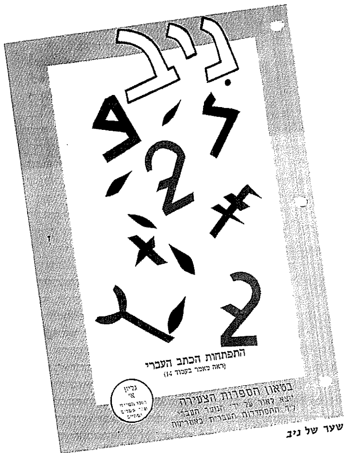
שער של ניב

ב ספרי התרבות העברית באמריקה: 80 שנות התנועה העברית בארצות-הברית, שיצא לאור ב-1988, נכתבו תולדות התנועה העברית בקיצור, כנדרש מהיסטוריה תרבותית, תוך הבאת כל הפרטים הנדרשים להבנת התמונה הכוללת, בליווי שרטוט הרקע החברתי והתרבותי, הסברים והערכות. אך מטיבם של דברים שפרטים רבים הושמטו תוך בחירת החומרים הראויים לפרסום בהיקף של שמונים שנה. עתה הגיעה השעה להשלים את הפרטים, למלא את החסר, להוסיף את הצבעים.