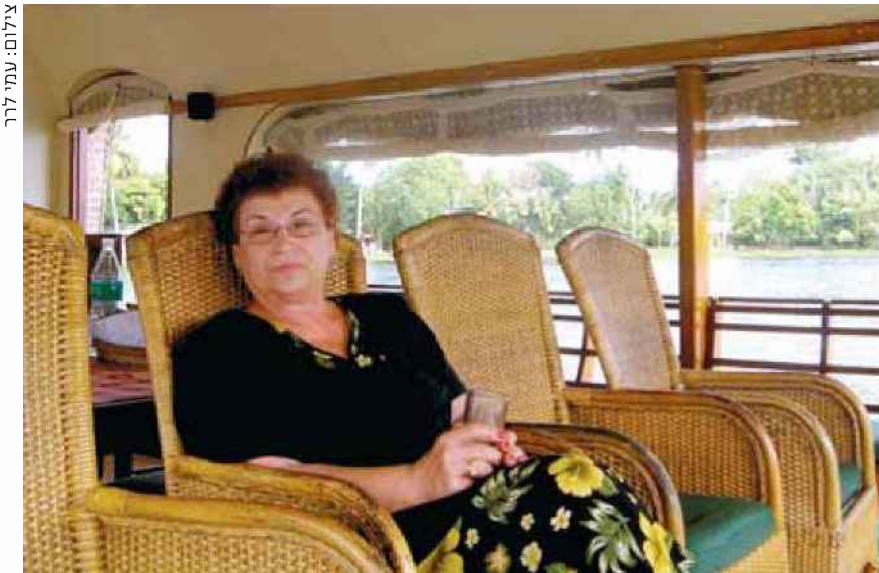
מגד. הודו הפכה לאתגר עבורה