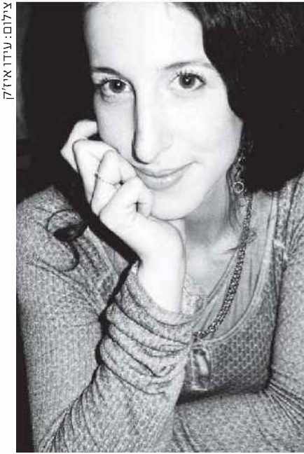
שביט. בהודו הדברים עלו וצפו