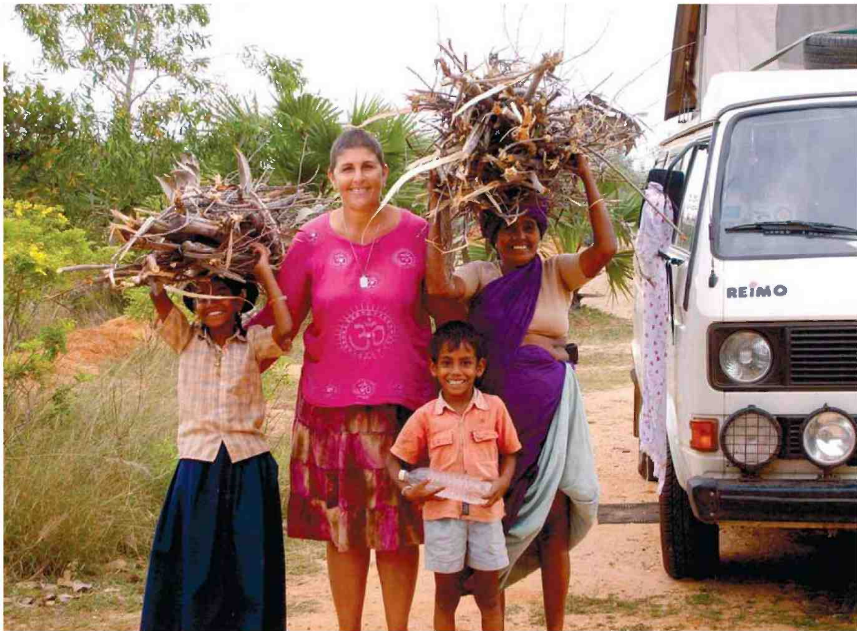
סקולניק. כל החיים היתה צל