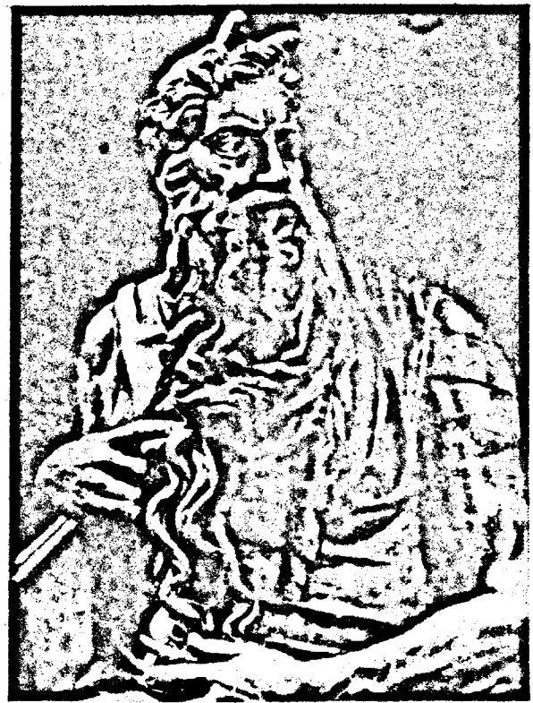
נחמה — מיכאל אנג'ל

ספרו של דוד כהן, חורג במעט מן ה„סחורה“ הספרותית ה- רגילה אשר אנו מכירים אותה בחיינו היום-יומיים. אילו היינו מש- תמים בשפתו, בודאי היינו מגדירים זאת — ספרות של ימי הנסוע וספרות של שבת האגדה הספרדית, אשר יסודה בחיי העבר של האומה, בגבוריו ומסרתו, לעתים הנה ספור-אפי, אך המאפיינה הוא הלידיקה העדינה, זו החונקת את גרוך אס-אט וצובטת נשמתך עם הקריאה. האגדה אינה נכתבת ראשיתה הוא החוץ בעל-פה, הגובל ברחי-קודש שנוה על המספר באנלוגיה ההיסטורית בדרש ובמוסר- השכל. המציאות של היום-יום משמשת קרש-קפיצה אל עבר הים הגדול של ההיסטוריה האנושית, של רגעי גבורה ומסירות נפש. כך משמשים המאורעות המיוחדים בהיסטוריה הרחוקה או הקרובה גשר אל היום-יום ושאלותיו, השפעה הדדית זו-וא זו נכון יותר הגשר החי הנבנה בין ערכים יקרים ודמיונות-עבר לבין חברה ואידיאלים כהיום, זוהי אם כן תכונתה היסודית של האגדה.