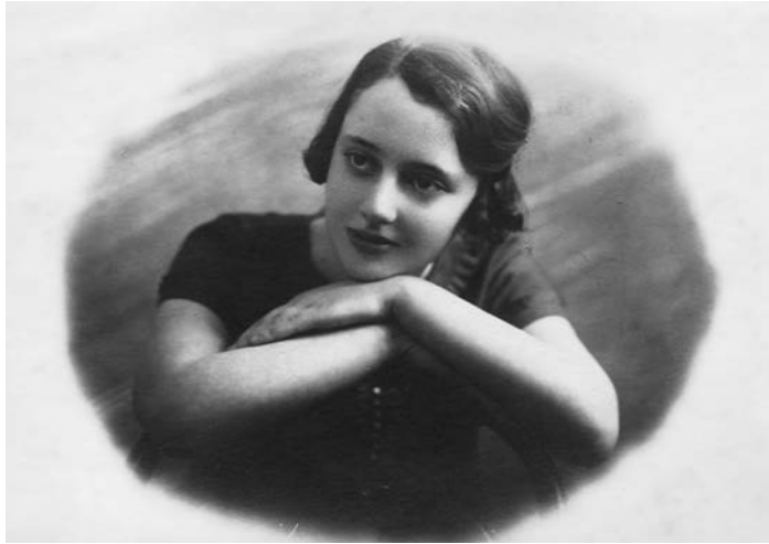
1 Im Alter von 16 Jahren

Im Rückblick erscheint das Leben von Menschen wie auch der Ablauf der Geschichte als vorbestimmt. Doch genau wie der historische Ablauf so ist auch der Ausgang des Menschenlebens offen. Es gibt viele Möglichkeiten, zwei Punkte miteinander zu verbinden. Auch Kowno und Tel Aviv kann man unterschiedlich verbinden. Nicht immer sind diese Verbindungen geradlinig. Es sind diese Verbindungslinien, die mich hier interessieren. Lea Goldbergs Weg mag zufällig erscheinen, aber ihre Stationen sind nicht nur ihre, sondern die einer ganzen Generation. Lea Goldberg steht hier für die Wanderungen osteuropäischer jüdischer Intellektueller aus kleinen Ortschaften in große Städte, von Ost nach West, hinaus aus der Provinz, hinein in die große Welt. Manchmal waren diese Wanderungen sogar Teil eines sozialen und politischen Weges vom Kleinbürgertum zum Sozialismus. Großstädte sind die Orte dieses Wandels und der Hochkultur; Aufklärung und Literatur sind Inspiration und Motor auf dieser Fahrt.