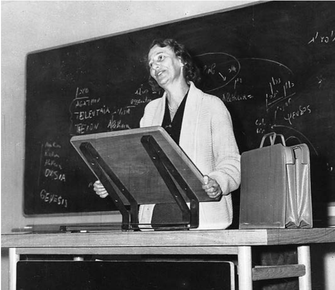
3 Vorlesung an der Hebräischen Universität, Jerusalem 1968

einflusst all mein Denken und Fühlen und macht mich und die übrigen Töchter meines Volkes völlig verschieden von den Frauen, die in eine andere Umgebung hineingeboren werden und in ihr leben. Und daher kann ich mich Misius oder irgendeiner anderen Russin gleich fühlen – wer auch immer sie sei, äußerst menschlich und ‚kosmopolitisch‘. Ich kann so ähnlich denken und träumen wie sie (so ähnlich, dass ein unerfahrenes Auge uns für identisch hält!). Aber so zu fühlen wie sie fühlt, zu denken und zu träumen wie sie – werde ich niemals können. Das vollkommene ‚Ich‘, vollendet wie es ist, kann ich nur in der hebräischen Geistes-Schöpfung finden.“ 13