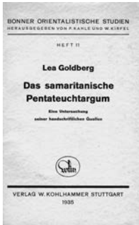
8 Titelseite von Lea Goldbergs Dissertation

Goldberg erzählt, wie sie ein hebräisches, ein russisches, ein litauisches und ein ukrainisches Lied anzubieten hatte. Anscheinend ist es ihr nicht gelungen, den Brief am Tag des Schreibens abzuschicken, denn am rechten Rande der ersten Briefseite steht: „31.1.33 was sagst Du zur deutschen Politik. Ich weiss auch nicht, was ich denken soll“.