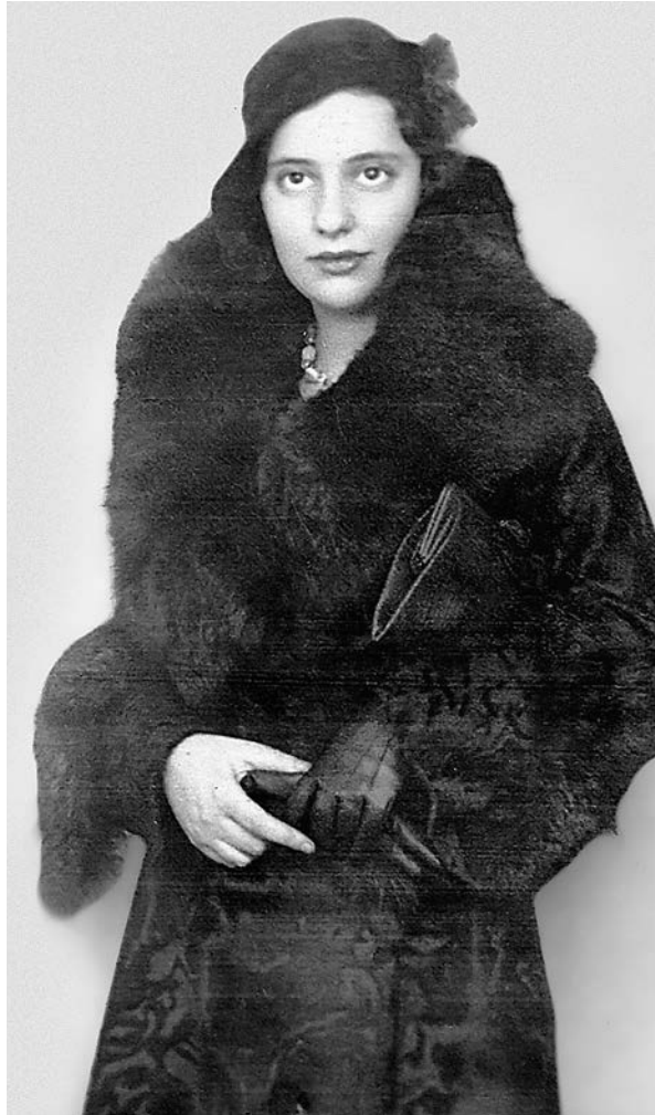
5 Lea Goldberg, 1930

„Man muss häufig Tagebuch schreiben und auch ‚objektive‘ Dinge notieren. Nach einigen Jahren wird dies wichtig werden“, schreibt Lea Goldberg im April 1931 in ihr Tage-