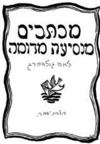
6 Hebräische Ausgabe des Buches „Briefe von einer Imaginären Reise“, 1937

buch. 35 Doch die Aufzeichnungen Lea Goldbergs aus den drei Jahren in Deutschland sind eher mager. Wer in ihrem Tagebuch ein historisches Zeugnis des Niedergangs der Weimarer Republik und des Aufstiegs des Nationalsozialismus zu finden sucht, wird enttäuscht sein. Diese Eindrücke kommen später indirekt zum Ausdruck: in ihrem Prosawerk „Briefe von einer imaginären Reise“, welches sie im Jahr 1937 veröffentlichte, in ihrem ein Jahr darauf erschienenen Aufsatz „Mut zum Profanen“, in den vielen Zeitungsartikeln und Notizen, die sie seit Ende der 1930er Jahre in Eretz Israel veröffentlichte, und in ihrem bereits erwähnten autobiographischen Roman „Ve-huh ha-or“ aus dem Jahr 1946.