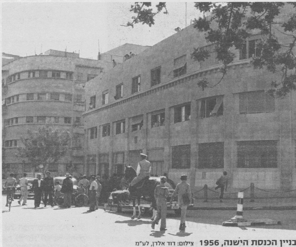
בניין הכנסת הישנה, 1956

מפא"י וההסתדרות". ואז הוסיף: "אני רואה באקט זה ששמו ה'פרשה' - אקט של פגיעה בסמכות ראשה של המדינה. הנימוס הממלכתי מחייב כל עורכי העיתונים היומיים ושלעת ערב, ואת בחורי הרפורטאז'ה שלהם, שלא יחצו עטיהם למלחמת רכילות וליבווי להכות על הנייר; שיזכרו: שלא חילול דמוקרטיה מדומה כאן, אלא חילול סמכות ראשות המדינה".