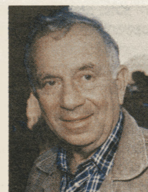
הותקף. יהודה עמיחי