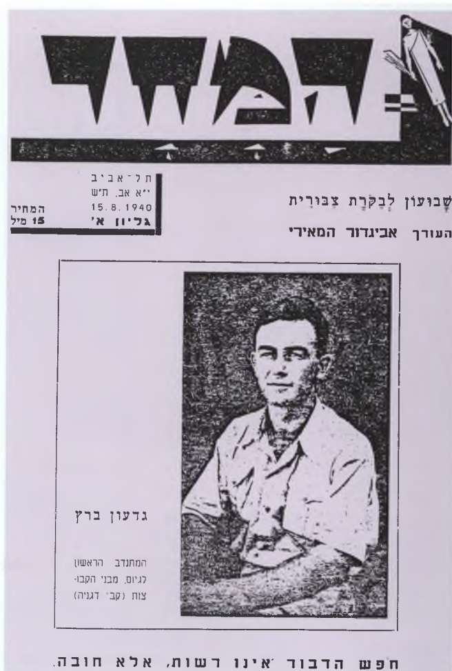
שער של "המחר" המחודש, משנת 1940

גיליון י"ב, מאלול תרפ"ט, זכה לשתי מהדורות זהות. יש בו "מכתב ללורד בלפור", המשתרע על שישה עמודים, ובו פנייה אל נותן ההצהרה הידועה על רקע ההרג שבוצע בארץ נגד יהודים (כמאורעות תרפ"ט), וכן פנייה נוספת לנציב העליון צ'נסלור, הרצופה האשמות כבדות. כן האשים המאירי את ז'בוטינסקי, במאמרו "הרוויזיוניסטים" המשתרע על ששה עמודים וחצי, על שלא הכין את חברי בית"ר להתמודדות עם הפורעים הערבים. למעשה מהווה כל הגיליון כתב אישום חמור נגד כל המנהיגים וכל המוסדות, הבריטיים והיהודים. ויש גם מסקנות. ומסקנת הסיום היא: "אל תתאזרחו! אם אין הגנה — אין אזרח ארצישראלי" — איש לגלותך ישראל!"