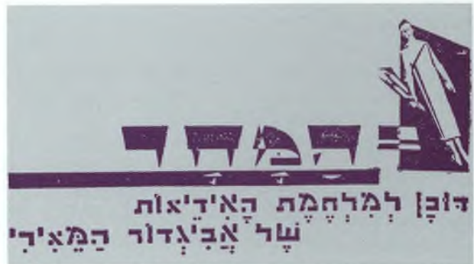
כותרת המשנה של "המחר" — "דובן למלחמת האידיאות"

משמע: רציני, אך בעין קורצת. וכך תהיה דרכו של "המחר" עד גיליונו האחרון.