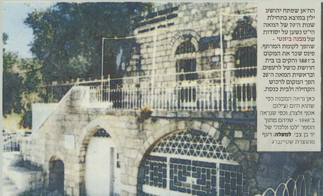
ה'ח'אן שפתח יהושע ילין במוצא בתחילת שנות ה'70 של המאה הי"ט נשען על יסודות של מבנה ביזנטי - שהפך לקומת המרתף. פינס שכר את המקום ב'1881 והקים בו בית חרושת כושל לרעפים, ובראשית המאה ה'20 הפך המקום לרכוש הקהילה ולבית כנסת. כאן נראה המבנה כפי שהוא היום, וכפי שנראה ב'1898 - שניהם מתוך הספר "לכו וללכה" של די בן צבי. למעלה: רעף מתוצרת שטיינברג