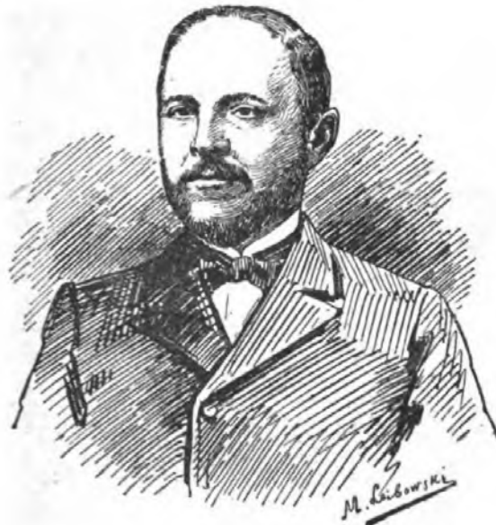
חיים נחמן ביאליק.

ילדותו בכפר. חיים נחמן ביאליק נולד בשנת 1873 בכפר ראדי שבפלך והלין. אביו היה מאלה הלמדנים בעלי-הדמיון שלא יצליחו בעולם-המעשה, והיה מתפרנס כל ימיו ברוחק, מתחלה כעוזר לחוכרי-קרקעות, ואחרי כן בתור מחזיק בית-מרוח. בזמנו יין להאכרים היתה גמרא פתוחה תמיד לפניו, ומעיניו הנתונים לענינים רוחניים היו רחוקים מהסכיבה המלאה עשן הקטרת והמולת שבורים. הוא הנחיל לבנו את כח-דמיונו, וחיי השדה מהרו לפתח את הכח הזה אצל הילד. הכפר ראדי היה „גוה שאנן מלא יופי צנוע של טבע פשוט ובריא, שמה בחלקו ומסתפק במועט. זוהר-רקיע, מרחבי-שדה ודומית-חורש האומרת: ררשני!" (1) הילד חיים נחמן היה מבלה את חוב ימיו ביער הקרוב לבית הוריו, והיה אוהב להשתעשע אצל ברכת-המים שבו. שם לקחה אזנו את הצלילים הראשונים של שירת התולדה, שהדם השמיע אחרי כן המשורר בשיריו „הברכה" ו„זהר":