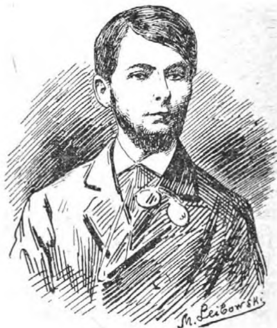
מרדכי צבי (הנצי"ר) מאנה (1859—1887).