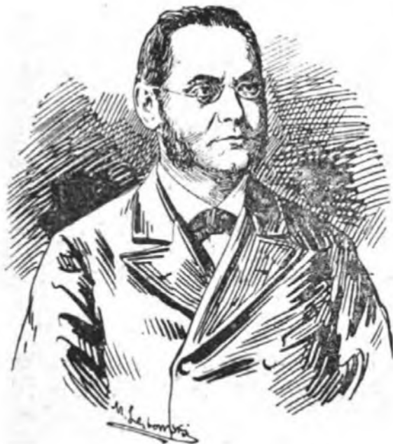
יהודה ליב נורדון--יל"ג (1830—1892).

ילדותו וחניכותו. המשורר יל"ג נולד בכ"א כסלו תקצ"א להורים אמידים, המהויקים בית-מלון בוילנה. הוא מספר לנו בעצמו על דבר ראשית חנוכו למודיו כדברים האלה: