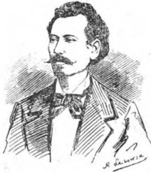
פרץ בן משה סמולנסקין (1842—1885).