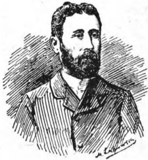
יהודה שטיינברג (1863—1908).

יהודה שטיינברג נולד בשנת 1863 בעירה ליפקאני אשר בביסאראביה. אביו, הסירסאדינורי קנאי ונלהב, הנכו על התורה והחסידות. הנער יהודה לבש מעיל ארוך, ופאותיו היו ארוכות ומסולסלות. אולם עולמו הקטן היה מלא יופי ופיוט. בית אביו עמד מחוץ להעירה, על שפת הנהר „פרוט השוקט והיפה, החוצה לו דרכו באדמה תרכה והשחורה שבין הרי ביסאראביה ורומיניה“ (1) . והנער החולם היה מבלה כמה שעות על חוף הנהר, בהקשיבו „להמית-הדממה של גליו העליונים, הנשאים בחשק ובבטחה למרחק לא-נודע להם, ונפשו הרכה וההומיה נשאת גם היא למרחק-היזפי“ (2) . גם בבית-המדרש מצא יהודה עונג רב באגדות התלמוד ובספורי-הפלאות של החסידים, שמסרם לנו אחרי כן בכשרון הומרי דק. כבן עשרים נשא לו שטיינברג אשה רומיניה, ובאמרו להשתקע בארץ זו פתח חנות של מכולת באחד הכפרים המוקפים מראות-הטבע יפים, שעוררו בו רגש השירה. שם החל שטיינברג לעסוק „השכלה“ ועשה בה חיל, אולם מסתרו ה"ך ודל, וכעבור שתי שנים אחרי נשואיו הזכרה, כגר, לעזוב את רומיניה בידיים ריקות. או שב לעיר-מולדתו ליפקאני והיה למורה עברית, אלא שאביו הקנאי תרכה להציק לו ואלצו לעבור בשנת 1889 להעירה הסמוכה ידינצי. שם דרבה שטיינברג להנות בספרות העברית בהתפרנסו בדוחק מהמלמדות, ורוחו נשאו להיות