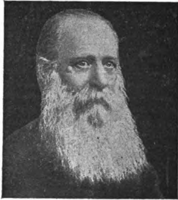
מוֹשֶׁה לִילִינְבֶּלוֹם (1843—1910).

מוֹשֶׁה לִילִינְבֶּלוֹם נולד בכ"ט תשרי תר"ד בהעירא קייזר אן שבפלך קובנה. אביו היה חבתן 2 עני, בקי במשנה ובאגדה, המגיד שעור בבית-המדרש הגאון נעוריים. לפני חבריו בעלי-המלאכה. את חנוכו, למודיו וקורות נעוריו תאר לנו אחרי כן לילינבלום בעצמו בספרו, "הטאות נעורים" או, הודוי הגדול של אחד המופרים העברים, צלפחד בר חושבים התוה"ה 3 (וינה, תרל"ו). הספר הזה ראשית למודיו. הוא אוטו ביאוגרפיה (ספור תולדות עצמו) של המחבר, והמעשים המופרים בו הם פוסקים לאותו הדור.