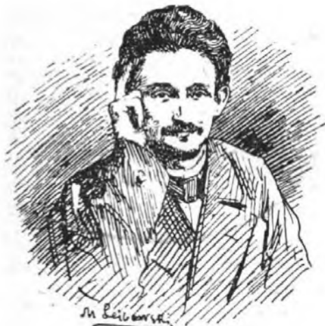
מרדכי זאב פייערברג (1874—1899).