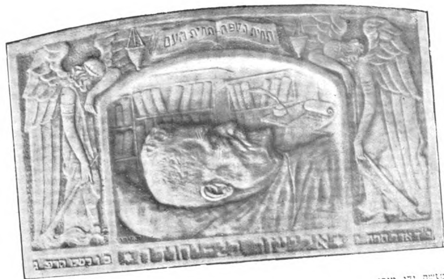
מצבת ידו מורו