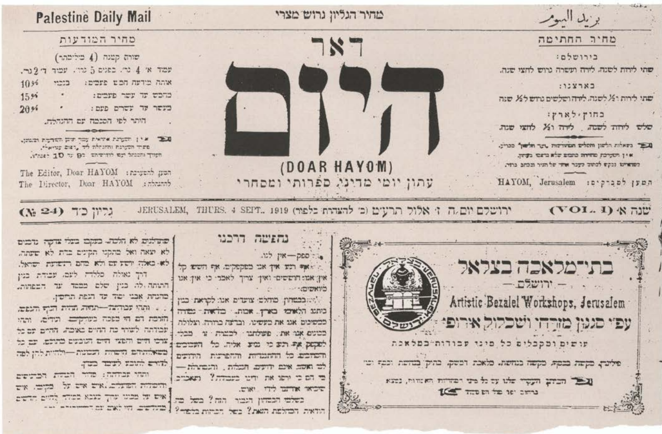
ה"לוגו" של "דואר היום" בשנת 1919

דברים הגובלים בדעות קדומות, וקשה להתווכח עם דעות כאלה. איני זוכר אף לא פעם אחת ש"דואר היום" חלה בצהבת. בכל אופן, זה לא בלט בחזותו החיצונית. באשר לתוכנו הצהוב כביכול, זה היה בגין הכותרות והתצלומים שבעמוד הראשון, המאמרים הלוהטים והמרעישים, הפניות אל ההמון והחומר הקל. אם נשפוט את העיתונים של היום לפי קניי-מידה אלה, נוכל לקבוע כי כולם צהובים. הצרה עם בן אב"י היתה, שהוא נולדו חמישים שנה לפני זמנו. המתחרים שלו בעתונים האחרים התחנכו וגדלו על עתונות משכילה, על המכתב-עת של פרץ סמולנסקי, ועל פלפול בכובד ראש כפי שנהוג היה בווארשה, במוסקבה ובפטרבורג. ואילו הוא הכניס לעתונות רוח-פרצים קלילה מפריז, מברלין ומלונדון, שבהן למד ומנהג התבשם.