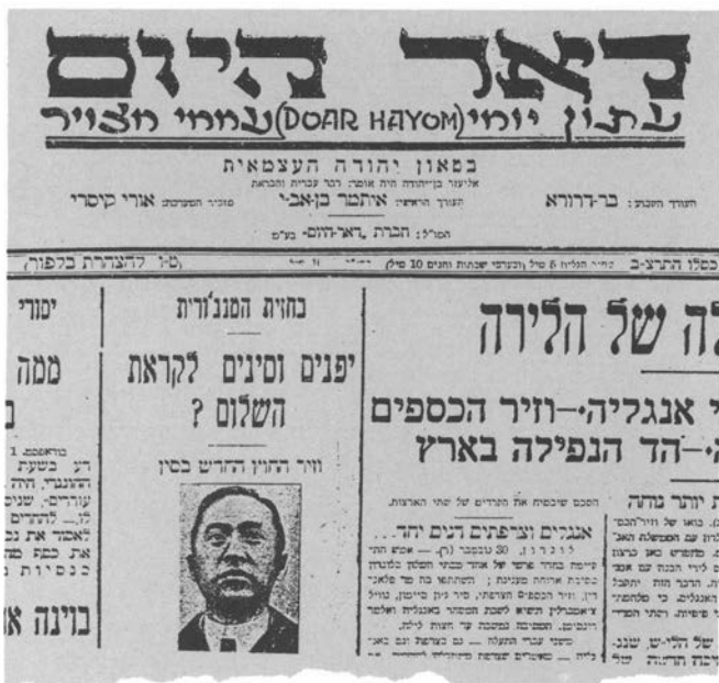
"דואר היום" כותרת שהיתה לו בשנותיו האחרונות

חידוש נוסף, שהיה בבחינת צלם בהיכל בעיני העתונים המתחרים, היה פרסום תצלומים בעמוד הראשון. עמוד זה של "דואר היום" כפי שעוצב בידי עורכו, היה חי ותוסס: כותרות באותיות של קידוש לבנה, תצלומים ומברקים עם כיתובים גדולים, בזמן שבעתונים האחרים הופיעו ידיעות מהעולם תחת כותרת אחת כללית — טלגרמות. את הגלופות המוכנות קיבל "דואר היום" דרך קבע משתי חברות אירופיות שסיפקו גלופות לעתונים — קלסטרס של אישים מפורסמים ותצלומי אירועים.