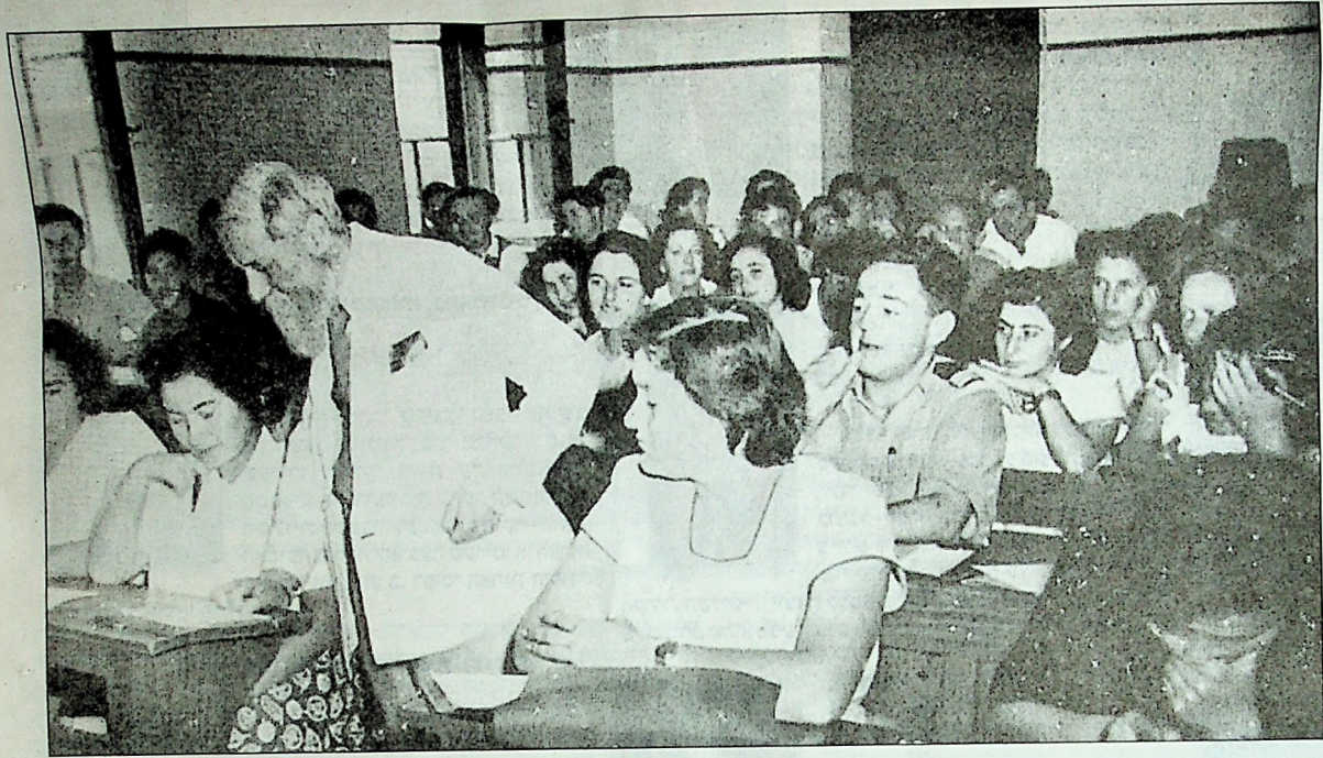
לנוכח הווייתו שלו שבתני וגיליתי מחדש כי בן לאדם אני. מרטין בובר בעת שיעור באוניברסיטה העברית

עם שמדבר הוא בגנישות ביום מן הימים עם וקן חכם, בספרו האחרון "פני האדם", מבליע בובר בתוך שרטוט האיש הזקן שעמו שוחח מילים אלו: להיות זקן הוא דבר נפלא, אם אין שוכחים כי המשמע הוא להתחיל. זהו שעושה את בובר הזקן אדם צעיר, הרי הוא שלימדנו כי היצירה מתחווה, היצירה נצתת, בכל שעת חלוף. וכל שעת חלוף היא יצירה. ברוך המחדש בטוב מעשה בראשית, ובכל בוקר חדש מתחיל את החיים מחדש.