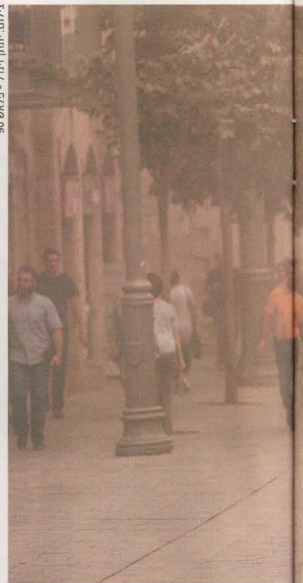
אין לי בעיה שהילד שלי יהיה כל דבר שירצה, אבל לא מתנחל בחברון. קלנו

לה לנשום עמוק, ופשוט נשאיתי איתה". מוטיב משמעותי בספר הוא ההתמודדות עם השכול – עמידה חזקה של משפחה אחת לעומת התפרקות של משפחה אחרת.