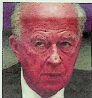
רבין. תחושת אשמה עמוקה

אבל עד שיקרה הדבר הנכון הזה, גילון – טירון יחסית בשוק הספרים והעיתונות – לא עשה את המהלך המתבקש. לא מכר עדיין וכירות או קידם את הסינופסיס מול ערוצים משדרים באמצעות סוכן אנרגטי. חבל. הספר כתוב כמותחן שירירי ויעיל, מאלה שנקראים בנשימה עצורה ומבוהלת, ויש בו המון תיאורים גרפיים מן הסוג