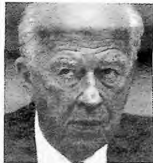
רבין. תחושת אשמה עמוקה

אבל עד שיקרה הדבר הנכון הזה, גילון – טירון יחסית בשוק הספרים והעיתונות – לא עשה את המהלך המתבקש. לא מבר עדיין זכויות או קידום את הסינופטיס מול עורצים משדרים מאמצעות סוכן אנרגטי. חבל. הספר כתוב כמותחן שריירי ויעיל, מאלה שנקראים בנשימה עצורה ומכהלת, ויש בו המון תיאורים גרפיים מן הסוג