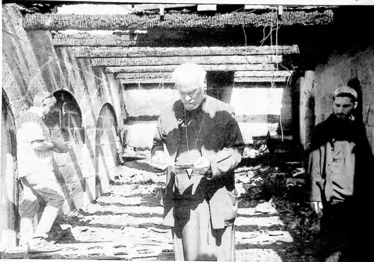
כניסת הלחם והדגים על שפת הכנרת לאחר הצתתה ב-2015. "הציבוניות הישראלית טעתה כשקראה להם עשבים שוטים"

מה רע יותר מזה? "בסופו של דבר, ממשלה רחבה שבה יישבו גם בני גנץ וגם בנימין נתניהו בקונסטלציה מסוימת". בסרטון תעמולה מהשבוע, אתה נראה יחד עם ראשי שירר תים חשאיים אחרים בעבה מס' כירים כמה נתניהו מסוכן. זו לא תמיכה ברורה בגנץ? אתה מאמין