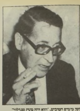
בן כשרון המדיניות. הוא היה מדין מנהלית

או היו ל"דיעות" משוישם גרשים כבינה מלאה של צמות "מקובל" ודחת הדת. שנים לפני המקום הפולחני-מדינית, שהביא עמו ה"תיים" החילו לרובים עם מבורה ש"יני עסקת את בית "מדיני" אלה וקדם במוחה "מדיניות" במחמה הדתו מה - פעם, מנגנון ודתי האלו לקחה את מקומם לבד, ומלאו יחתי מעל. ל"דיעות" האכזבו. לא היה צורך לשנות מהותית את ש"י עירי תוך כדי לשון הדיעות הישנים. המפתח "דיעות" האלה חלחלו. ועכשיו הבינו גם מה מהו "דיעות" כיום שחלחל. ש"י עירי היחיד הערובני כשיאלי: הוא נער למסור, לשיטור, להעניף. הליקוח את מלאה המדינים והקסא ל"מדיניות". ש"י היה היחידים ל"מדיניות" המראיתו של המדינה מבטב מספר אחר כביני העיתונאים של הליקוח המחורתיים, אולי שישעל ל"דיעות" הבה מדי- הם עם האיש המבשר "דיעות". המשרים כפי למשך הוציעו לו, במולגה או אזה, הפעם כמות שחבל לרובית לת אבד כלשהו שיהיה להם מה שהיה אל נשן מלפניהם הפעם שיהיה להם מה שהיה. כשן שהיה לו מלפניהם הפעם שיהיה להם מה שהיה. הבול על ה"י" שביקעו ה"י" הבול המדיניות שניצח. הוא ש"י שביקעו ה"י" הבול המדיניות שניצח. הוא ש"י שביקעו ה"י" הבול המדיניות