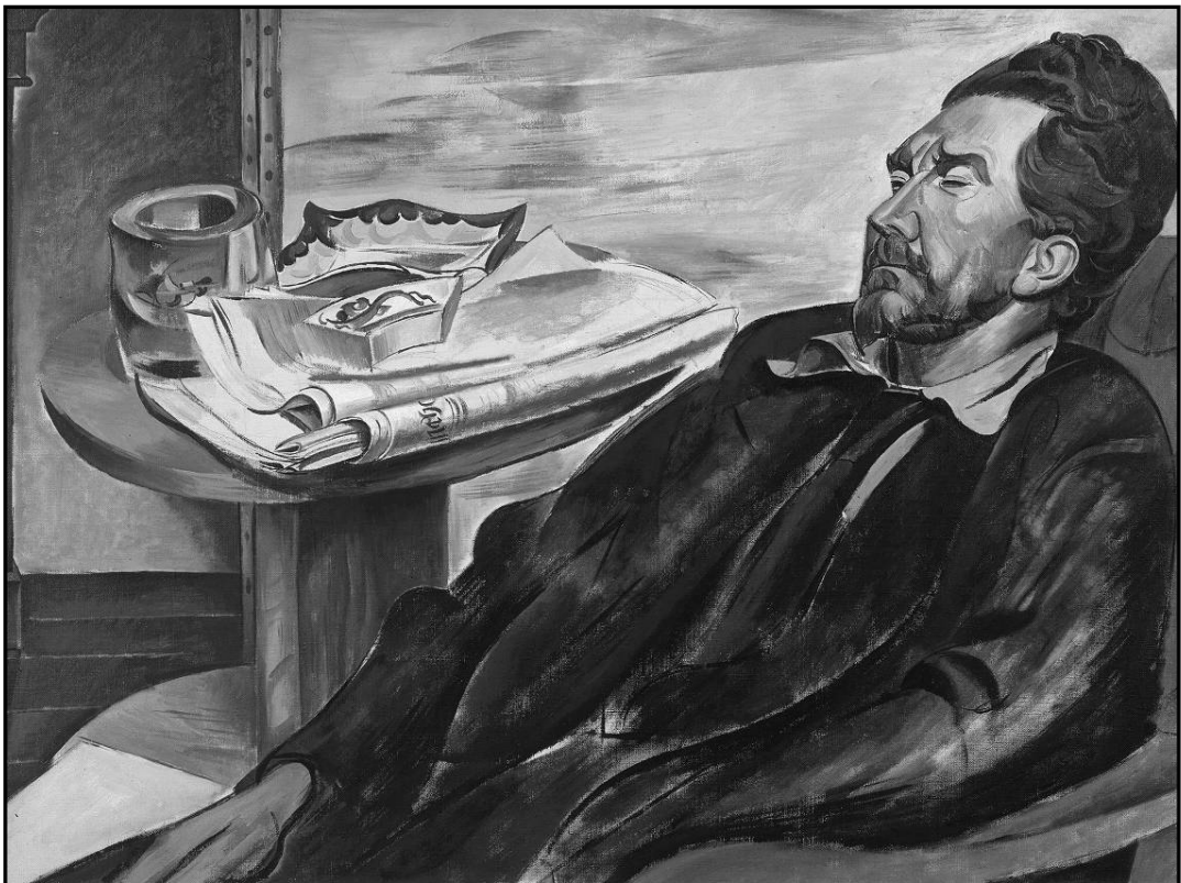
דיוקנו של עזרא פאונד. 1939.