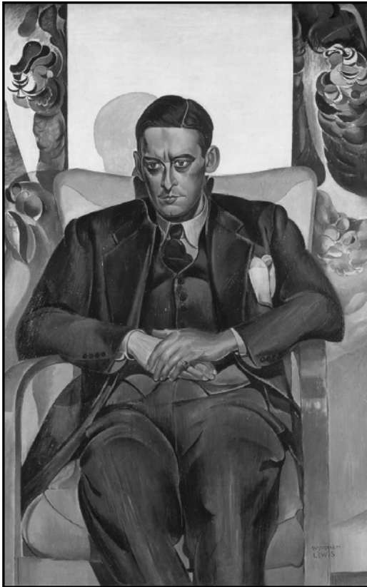
דיוקנו של ת.ס. אליוט. 1938.