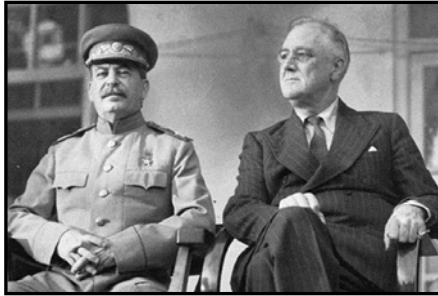
רוזוולט וסטאלין, 1943.

וולס: דעתך על המעמדות השליטים של ארצי חיובית משלי. אך האם ישנו