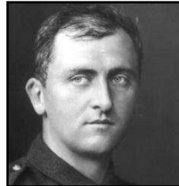
תומאס ארנסט יום (1883-1917)

סורל הוא אחד מן הכותבים הראויים לציון של התקופה, ולבטח הסוציאליסט הראוי ביותר לציון מאז מרקס; וסביר להניח כי השפעתו תגדל, שכן, למרות מה שנראה כעליונות הבלתי-מעוררת של ההדוניזם הרציונאליסטי בהגות הפופולארית, הראייה האבסולוטית של האתיקה, העומדת בבסיס טיעונו, זוכה בהדרגה לעדנה מחודשת. נכון הדבר, כי ניתן למצוא שילוב דומה של אידיאל קלאסי עם סוציאליזם בכתביו של פייר-ז'וזף פרודון (Proudhon), אך סורל מגיע בעת עליזה יותר. האידיאולוגיה שפרודון תוקף בשלה יותר עתה, וניתן לאמוד ביתר קלות את השלכותיה האמיתיות. רבים מתחילים