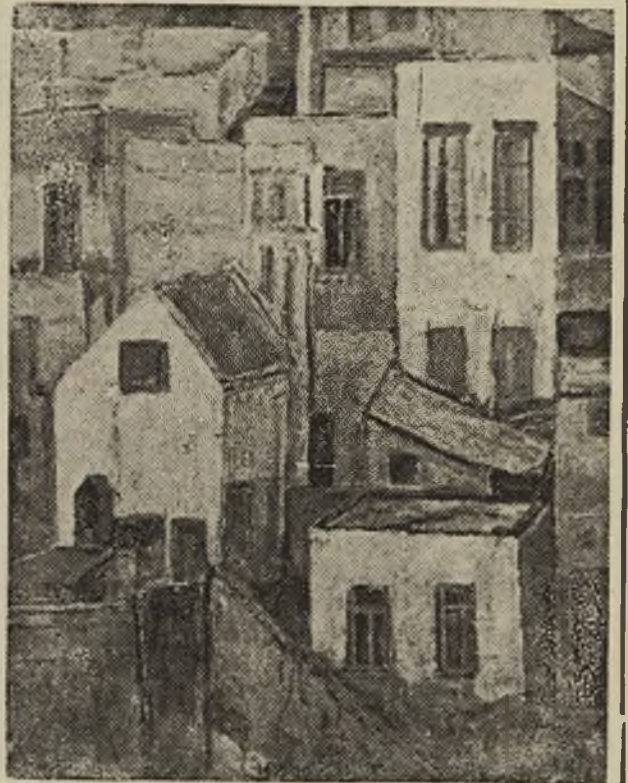
יהושע גרוסברד: שמן, סימטה בואדי סליב, חיפה.