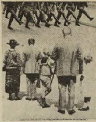
גרמניה, גרמניה מעל לכל

(חדר מגורים של משפחת פועלים בו נמצא גם המטבח. הינקמן נכנס. באגרופו הוא מחזיק חפץ קטן. הוא מביט בו כל הזמן, גרטה אשתו עסוקה ליד הכיריים).