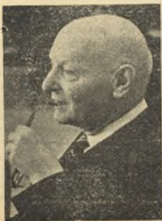
יצחק שבסי-זינגר — שונאים, פרק מ' תוך רומאן. עמ' 6-5