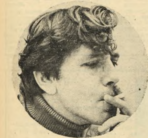
עמוס עוז — סיפור קצר ע' 3

בעזרת משחק אפשר להבין גדר טובה, גבה מעקה הוא גדר טובה לילדים במרפסת שיצדעו שאפשר לעוף בעדה ולא יעופו יראו את המרחק ויאהבו אותו. שעות יבטו מבעד לסורגיה ותגבר אהבתם; זה טובה.