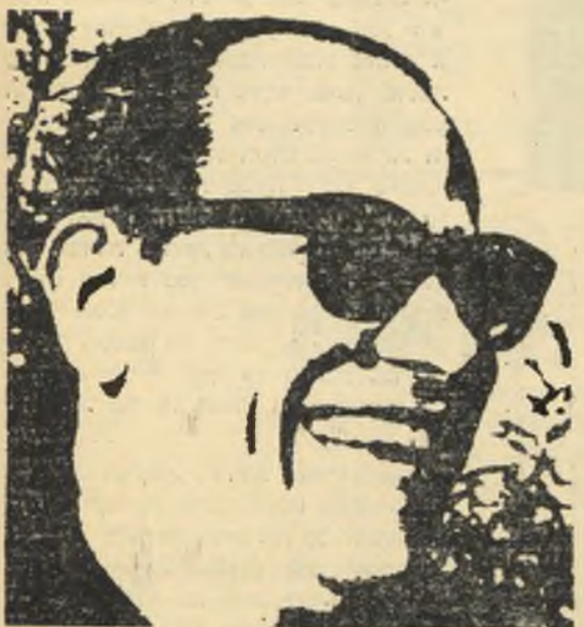
נגיב מחפוז — המשך הטריולוגיה, ממיטב יצירתו, פרק 4; ע' 4