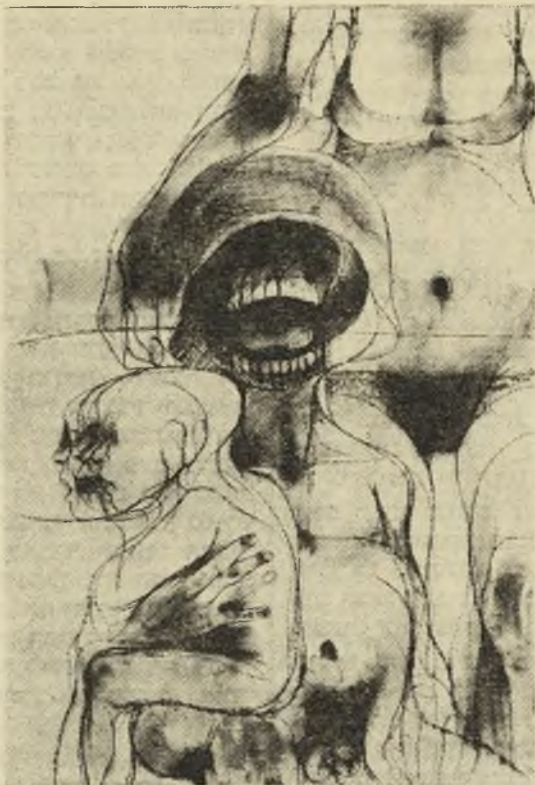
הרוד רובין — ציור

לא מלאו לו ארבע עשרה שנה. אשר לקברן עצמו, אדם עגום, רחב-גרם, שתקן ועקשן, הוא החליט שלא לעבור בשתיקה. אבל השנים חלפו בשתיקה. הקברן עבר גם הוא לגור בבקתת בנו הנותר ועוד