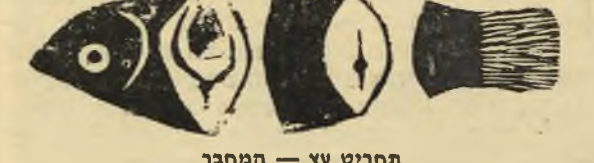
תחריט עץ — המחבר

שכבנו לעיתים קרובות; על החוף בלילה, בטיולי סוף שבוע, בחדרי או בחדרה, כשההורים לא היו בבית. ואז בא הסתיו ועימם במקצת את האהבה שלנו. דוסטויבסקי אומר במ-קום כלשהו שפלא הוא מה שקרן אחת של שמש יכולה לעשות לנפש האדם. עכשיו היתה שמש נדירה יותר; מזג-האוויר היה לעיתים קרובות קר וגשום, ולבשנו סוודרים ומעילים. גם חזרנו לבית הספר לשנת הלימודים האחרונה. השחייה בים והטיולים ברגל באו לקיצם, וחיי האהבה שלנו נתחמו לחדרים שלנו, עם כל אותה השגחה על השעון