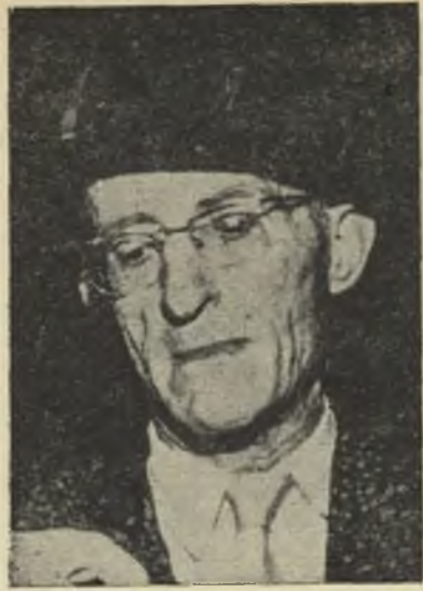
אצי"ג — מי שבא פן השמאל אל הימין.

מויבן שמיד עולה כאן שמו של נתן אלתרמן ועולים שיריו הפוליטיים, אך אלתרמן הוא מקרה התובע עיון לעצמו.