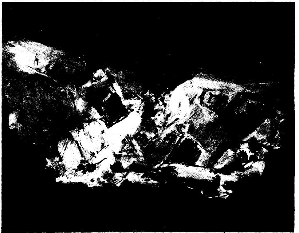
שלמה ויתקין חמר שנלקח מקורי חלומות חצה את הבד וייסד מלכויות של תצורות הניחנות בסבירות רציונלית חלקית וביצירות ספונטנית על מנת לברוא הרמוניות רוטטות. ■