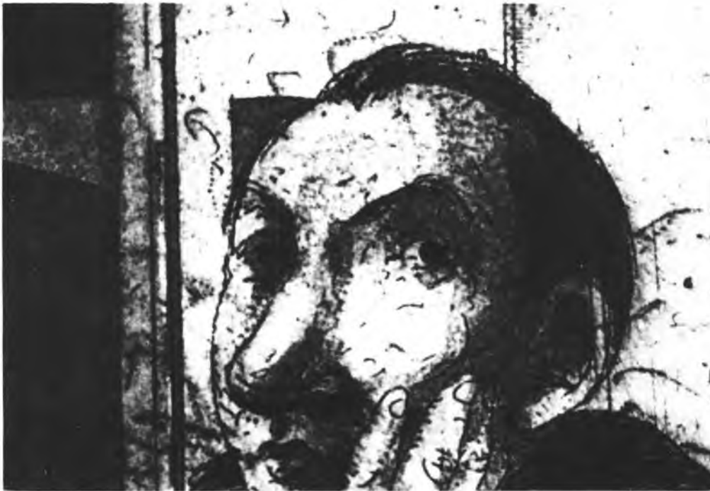
איור: דוד גרשטיין

בשורה הראשונה של התלמידים המעולים, ובמקצועות מסויימים, כגון היסטוריה וספרות, אולי גם הייתי הראשון שבהם, והן כחוג המשפחה. אבל ברגע שהתגבר המתח, מטעם זה או אחר, הופיעו לאלתר בעיות ההיגוי. הלשון לעה כפי. אי-אילו אותיות הקשות לכיטוי מאחיותיהן, היו ממש בלתי-אפשריות מבחינתי, וגם האחרות, הקלות יותר, מעדו על שפתיי. לא ייפלא שנעשיתי אמן של תחבולות כיצד להימנע מהופעות פומביות בעל-פה, וכנגד זה עמדו העבודות בכתב, וכיחוד החיבורים הספרותיים, כסימן של השתפרות בלתי-פוסקת. ההתחמקות של הכתיבה היתה בשבילי איפוא לא רק פתעל-יוצא של הנטייה היוצרת, המתחזקת והולכת, אלא פרי