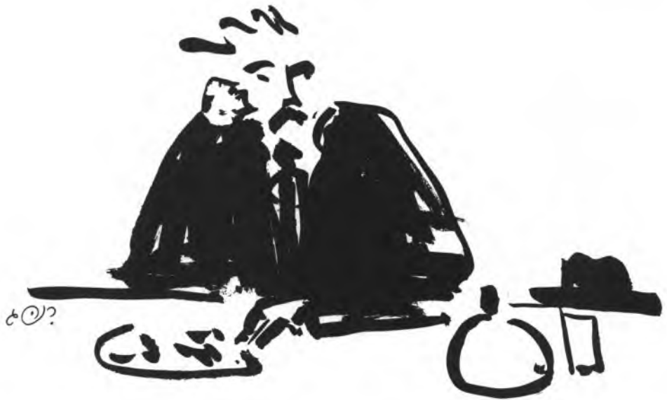
איור: רינה ג'

שונה מזה היה מצבו של צמד, שניקלע מפעם לפעם לחבורתם. הוא היה בעיניהם מין קוריוז יוצא-דופן שאינו ברת-חורות לא לגבי השגת עבודות ארעיות ולא לגבי התחרות הבלתי-פוסקת לתפוס מקום כלשהו בכותל המזרח של הספרות העברית הצעירה. הוא עדיין שקוע באותו עולם מאה-שערימי עבש שלו.