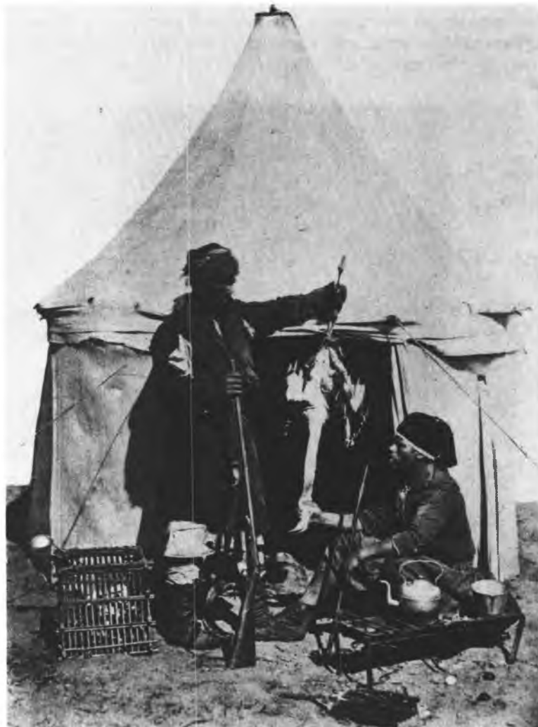
צלם: פרנסיס פרץ (אנגליה) 1822 - 1898 "צייר ערבי וטבח" (1856) 220x158 מ"מ

תיאופיל גוטיה, הסופר והמבקר, נוסע למזרח, כותב שירים על המזרח וממליץ לקנות ציורים של המזרח. וכשגוטיה עושה, כל מי שחושב עצמו אינטלקטואל מחקה.