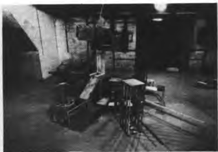
פסלו של נחום טבת בסדנתו בתחנת רידינג ת"א. אוג' 87.

בשנים האחרונות הושקע מאמץ ממוקד בעידודם של אמנים בתחום האמנות הפלסטית, התיאטרון והקולנוע. מבנים תעשייתיים קיימים ובלתי־מונצלים הוסבו לאולמות עבודה, המשמשים בעיקר לציירים ולפסלים הזקוקים לחללי יצירה נרחבים. מבנים אחרים, כמו תחנת רידינג הישנה בירושלים, נתרמו למופעי תיאטרון ולאתרי הסרטה.