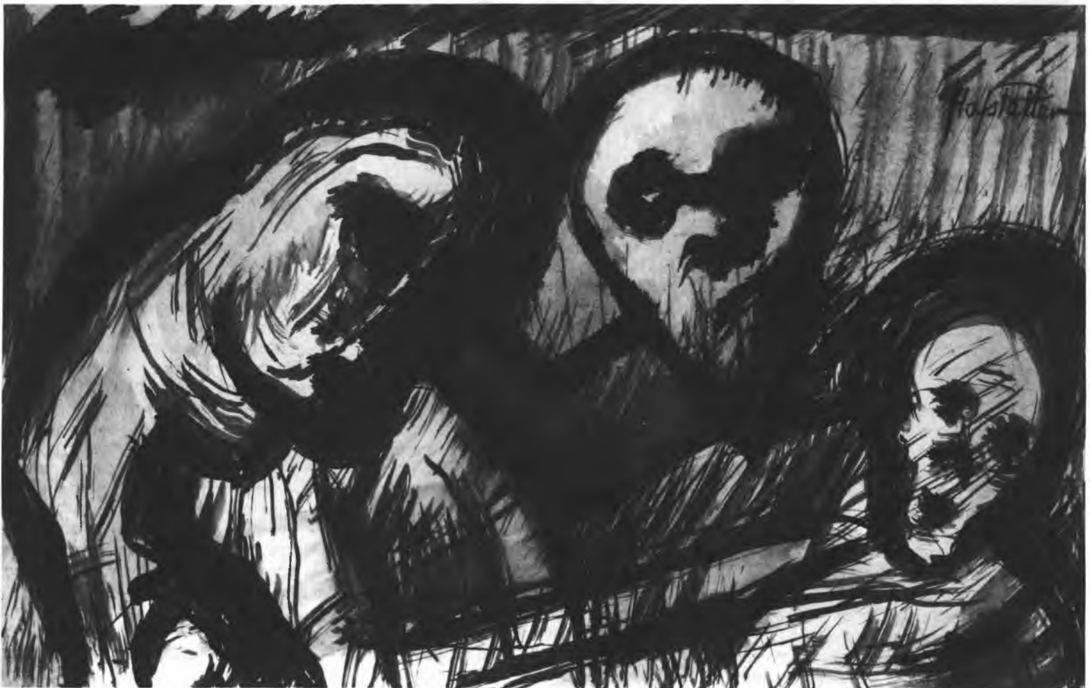
איור: איזאס הופשטטר

צעיר: אסור לסמוך רק על ספרים. שלושת הזקנים: תשתוק. צעיר: אני רק הסכמתי. זקן ג: כמו שאמרתי. זקן א: זה לא ספרים. זה חיים. הם העלו את הכל על הכתב. צעיר: מתי הספיקו? זקן ב: בעיקר כלילות. הם ישנו מעט. אחרי העבודה. לפעמים לאור הנר או לאור העששית. זקן א: או בחושך, כשכמעט לא יכולת להבחין בין ירוק לצהוב. צעיר: והיה להם שקט שקט לכתוב? זקן א (לעצמו): שקט, שקט, שקט. אף פעם אין שקט. אף פעם לא נותנים לכתוב. תמיד חסר משהו. לפעמים אין דיו... זקן ב: ולפעמים הדיו מתיבש בעט. זקן א: ולפעמים נשברים העטים. ולפעמים האותיות קטנות מדי... זקן ב: ואי-אפשר לקרוא מה שכתבת. ולפעמים האותיות קטנות מדי... זקן ג: ואי אפשר לקרוא. זקן א: לפעמים עש נכנס לספר (בוחן את הספר העבה שלפניו) ואוכל עמודים שלמים... זקן ב: שורות, משפטים. זקן א: עד שאי-אפשר להבין את הכוונה. זקן ב: מורה על הצעיר ועל הקהל כאומר: מה אתה מגלה להם. המדובר בדיברי סוד שאסור לגלותם. זקן א (מסכים רק חלקית): לא, זה לא היה קל. לפעמים העיניים מתקלקלות ואתה כבר לא רואה כלום. ולפעמים אתה מתקלקל. שתיקה. זקן ב: זה אף פעם לא קל. מי אמר שזה צריך להיות קל. זקן ג (מורה על הקהל): להם יותר קל. אני אומר... זקן א: העבודה שלנו אחראית וקשה. זקן ב: אנחנו שומרים על הגחלת - זקן א: שלא תכבה. אנחנו האחרונים על המשמר (מלטף את הספרים) זקן ב: דור אחרון לשיעבוד. זקן ג: ואחרון לירוק. (בהתעוררות-פתאום) אחרינו כבר לא יהיה ירוק כזה בעולם. צעיר: אנחנו נשאיר את הכל בצהוב.