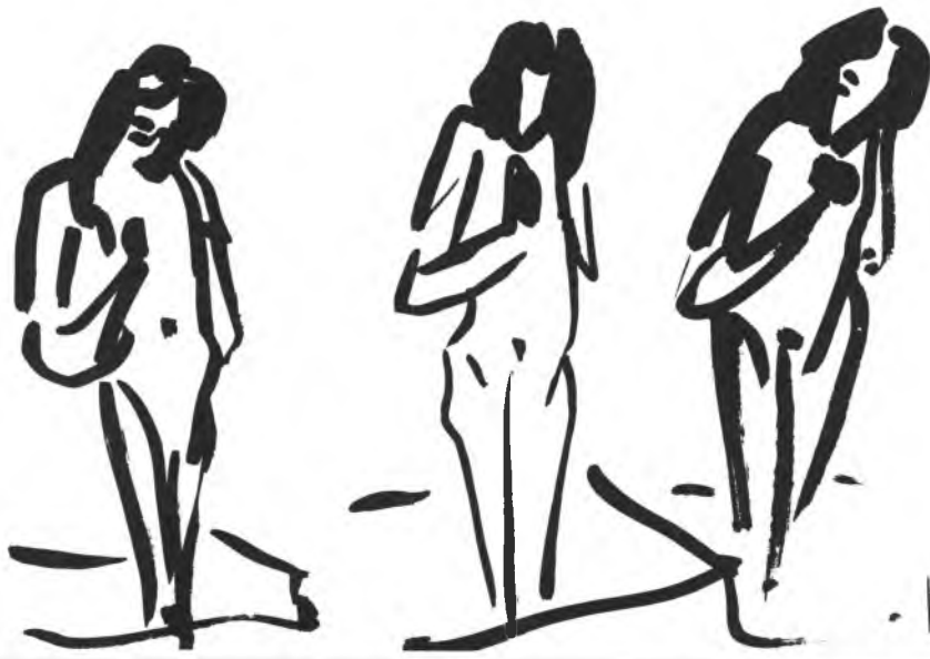
אור: רינה ג.

קפלי את כנפייך, דגרי כיונה, היי יונה שאוכל לאהב בשקט, יקירתי, אהובתי הנסערת, אם לא - אני אמות. 1922