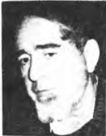
מחזה קצר עמ' 26