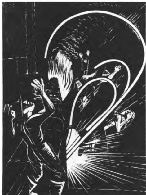
חיתוך עץ: משה גת

— שושנה יובל: העיקר לא להסתכל על המצב כעל גזירת גורל, כעל התרחשות הקורית באיזשהו חלל שאין לנו השפעה עליו. יש לנו השפעה, שליטה ואחריות וחייבים לעשות את ההחלטות הפוליטיות ולהשתמש בהן.