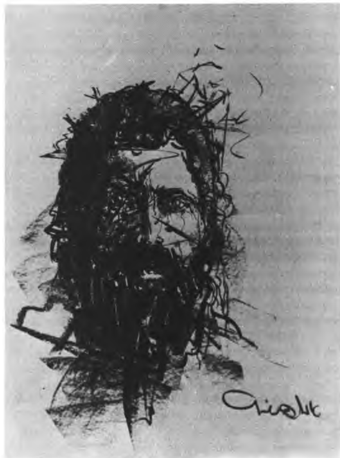
בנר פורטרט; ציור: אורי ליפשיץ

הרי חשבתי שיהיה איזה מקום שבו יהיה אחרת. ואני חליתי. פשיטא. חליתי. עד אין כוח חליתי. ובאו אלי מחשבות כמו מעדרים בראש. וביקשתי להיות מסוקל באבנים. ומבקר אחד בבית חולים אמר: הנה הסופר הידוע חולה, ובמחלתו הוא כותב ומבקש להתנקם בבריאים.