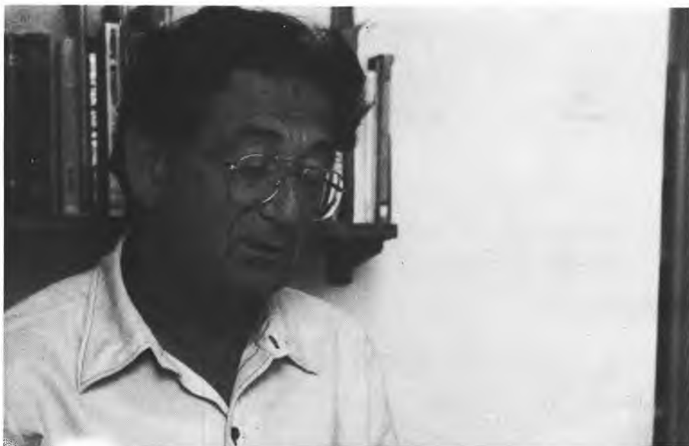
פרופ' יהודה באואר

פרופ' יהודה באואר, יליד פראג 1926, עלה לישראל ב-1939. תחום עיסוקו המחקרי — ההיסטוריה היהודית העכשווית. מזה 25 שנה מתמחה בנושא האנטישמיות והשוואה.