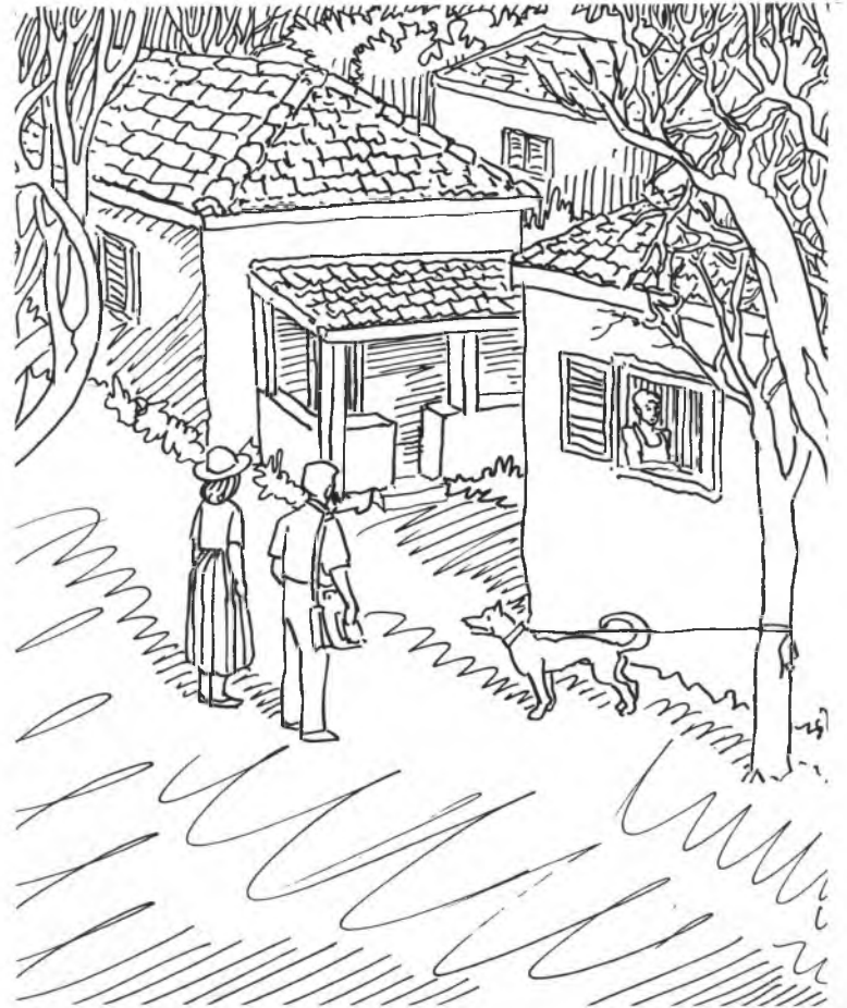
איור: אברהם עייש

לגדליה אין שום חשק לפתח אתה שיחה על האנוכיות שלו בשעה שגחלים בוערות תחת רגליו. הבית הנכסף של דודו נמצא במרחק שתי דקות הליכה ושוב ניצב השטן בדרכו, הפעם בדמותה של בחורה זו, כדי לטפוח לו על פניו.