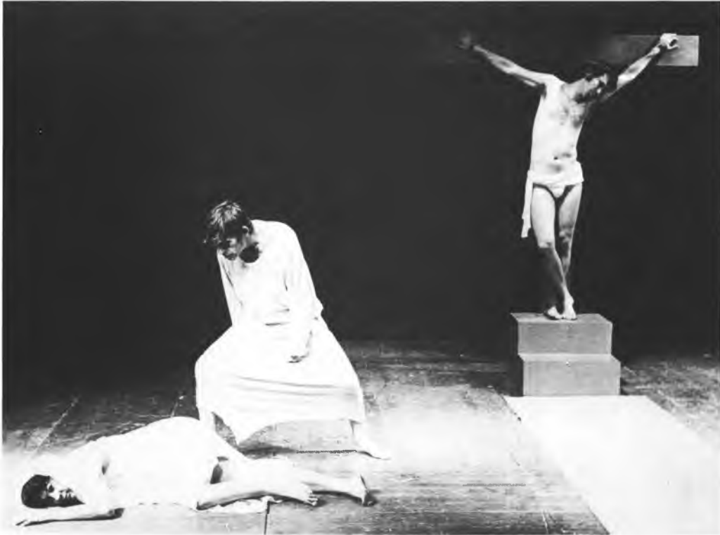
מתוך ההצגה: "חברים מספרים על ישו"

שנהרגו בפעמים הקודמות"; פעמים המצויינות בתאריכים המצביעים על מלחמות ישראל 1956, 1967 וביניהם מופיעה גם 1974, תאריך המצוי בתחום העתיד לגבי מחזה שנכתב בשנת 1972. כך מרמז קינן על נצחיותה ואינסופיותה של המלחמה, המשכפלת תהילה וציוני גבורה חדשים לדור הלוחמים. הוא צוחק למיתוס הגבורה המלחמתית, ולועג לדמות המיתית של הקורבן הנצחי שעברה טרנספורמציה מקורבן הפוגרומים לקורבן המלחמות של המדינה הריבונית.