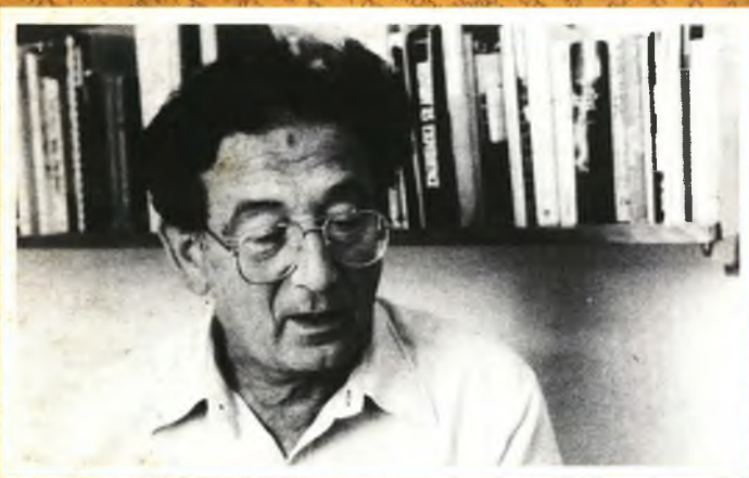
הורדה טהלי, לאורכ באורכ