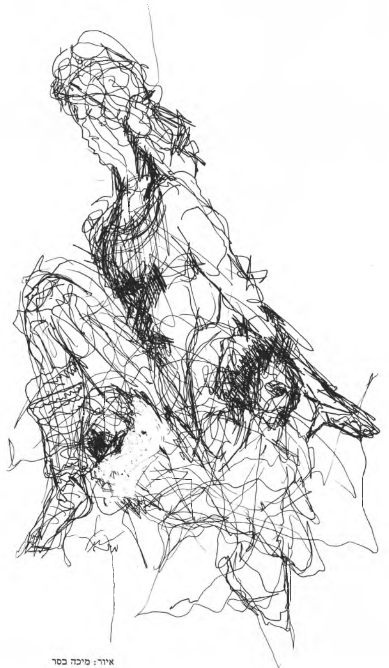
איור: מיכה כסר

הלכתי הביתה ברגל, כי היה יום אביב יפה, וכל הדרך מישל ריחפה לפני ופיטפטה לעצמה בעליונות.