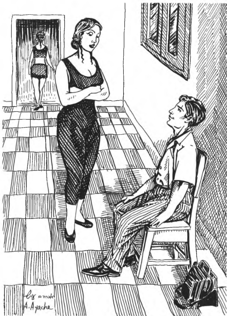
איור: אברהם עייש

מהוללים. הם לא ראויים למריטת העצבים שלך. שום איש לא ראוי לכך. "אתה לא מסוגל להבין", אומרת לו בת-שבע, "מה מרגיש אדם שכוער בו להט-היצירה כי אתה לא אמן."