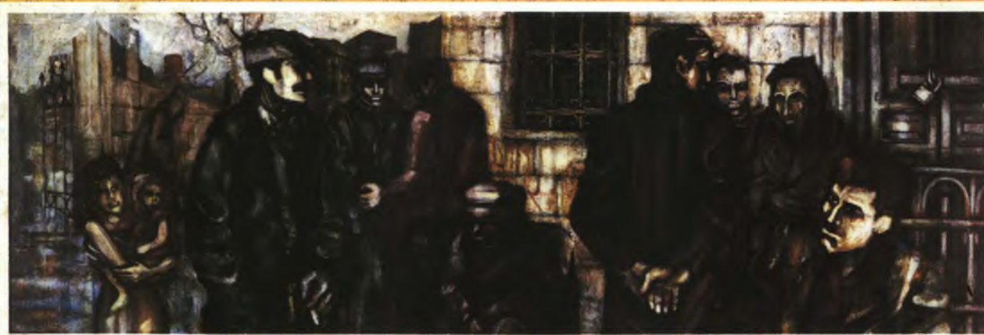
התמונה: יואל טייטלבוים