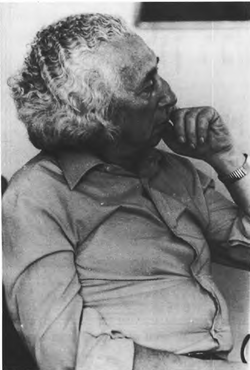
אבא קובנר — וועידת אגודת הסופרים, 1983

וזוהי נקודת השבירה והוויתור של האם. ברגע האחרון היא המוותרת. האם היא ככל אם, דווקא בשל היותה "אמא! לא!" והיטיב קובנר לתאר את המתרחש בתוך נפשה,