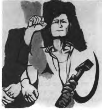
40 שנה למלחמת האזרחים בספרד — כרוז

כל הסובייטולוגים המקצועיים לא האמינו להם. בחוגים האקדמיים לא היתה שום הערצה לאנשים כמו הלן קרר ד'אנקוס (Helen Carrer d'Encausse), שהזהירה אותנו במשך הרבה מאד שנים מפני ברית-מועצות אסיאתית ומוסלמית ומפני אבק השריפה המרכז אסיאני עליו ישבה.