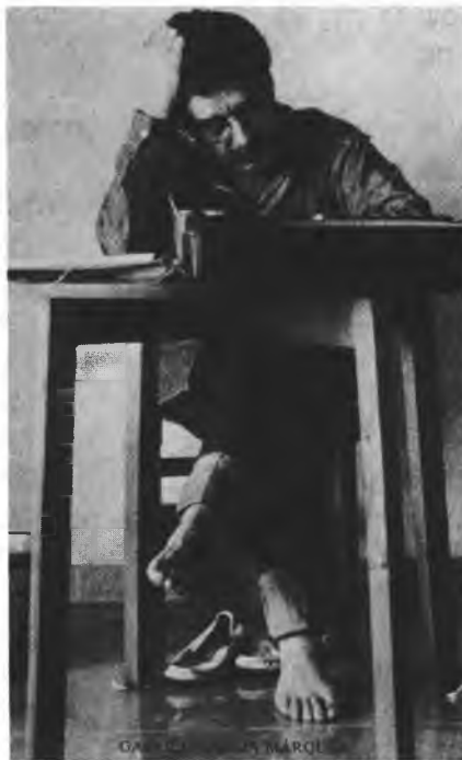
גבריאל גרסיה מארקס

"לא היינו משערים, חוסה יקירי, שתהילה רבה כל-כך נכנסת לתוך נעלי... השעה היתה כמעט שש, הגשם הרק בן אלפי השנים פסק לשעה קלה, אך העולם הוסיף להיות עכור וקר..."