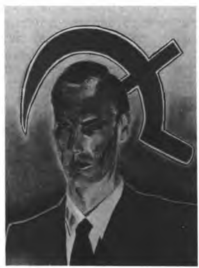
יעקב מישורי: 1982

באופן אישי אני חושב, שהוא היה מיותר ובו בזמן גם בזבזן, בלתי מיומן בצורה מסוכנת, וקצר-רואי ביחס לקרמה כלכלית. תהיה האמת אשר תהיה, קריירת הקומוניזם במאה העשרים אכן מאשרת את הטענה, שהוא זוכה להזדמנות ול-גיטימיות חזקה בארצות הנתונות במתח של תיעוש מוקדם, ארצות שחסרים בהן המוסדות והמעמדות המסוגלים להוביל את המדינה קדימה מבחינה כלכלית בצורה הטובה ביותר, שתבטיח את עליית רמת החיים לכולם. צריך אבל לזכור, ששיטות קומוניסטיות (שנדחו על-ידי רוב תנועות העבודה) נוצרו בגלל העובדה שלקומוניסטים לא היתה לגיטימיות מספקת להשיג ולשמור על תמיכת העם בשום מדינה שהם שלטו בה, אפילו במדינה מהפכנית כמו ספרד הרפובליקנית. ברגע שנפרץ המחסום הראשון, והפיגור הכלכלי המתמשך בימי הקומוניזם נעשה בגדר עובדה, נשחקה לגיטימיות של הקומוניזם באופן הולך וגובר.