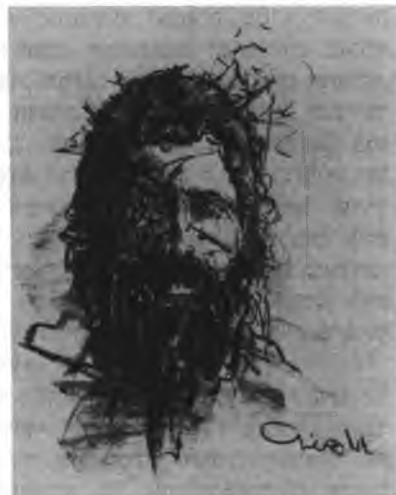
יוסף חיים ברנר, ציור של אורי ליפשיץ

תרבותית שקטה ורוגעת. אולם כשם שארץ-ישראל ועריה אינן מאבדות, ואף אינן יכולות לאבד את ערכן בעולמו הרוחני של עגנון, אלא את ממשותן הפיזית בלבד, כך גם ברנר. עם השנים דמותו הולכת ומאבדת את ממשותה. במסגרת עולמו של עגנון, השקוע עד מעל-לראש בעצמו וביעודו, אין מקום לעבודות ההווי, לצעקה, לאף-על-פי-כן הברנרי. ברם, לעולם אין דמותו של ברנר מאבדת את ערכה. הערכים שהיא מייצגת הינם בסופו של דבר אותם ערכים, שנשאו את עגנון שוב ושוב אל חופיה של הארץ, אולי כל נסיונו להציב מצבה לעולמה של היהדות שואב בסופו של חשבון אף הוא מערכים אלו ומתחושת