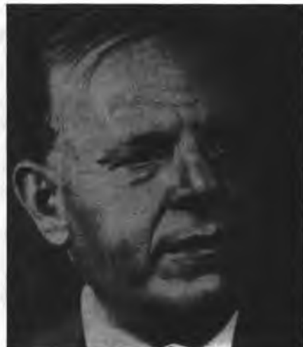
חיים נחמן ביאליק