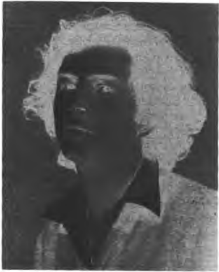
מגוייסות האינטלקטואלי כיצד?

אך אפילו נבסס אותו מוסר על כיבוד זכויות האדם והאזרח, לצד קיום קפדני של כללי הדמוקרטיה, עדיין לא חבקנו את כל הכלול במושג הערכים. וכאן, עלינו להודות: יש ערכים שונים לאיש הימין ולאיש השמאל; יש ערכים שונים לאיש הדתי ולאיש החילוני; יש ערכים שונים לליבראל ולסוציאליסט. אפילו התרוקנו רבות מזיקות אלה מתוכנן, או התערערו חלקית, דווקא אז יש צורך, וצורך דחוף, להגדיר מחדש יעדים חברתיים ואינדיווידואליים. יש בצרפתית מושג של PROJET DE SOCIÉTÉ, כלומר, של יעד חברתי מקיף. אפילו נקבל את עצתו של בה"ל שלא ללכת בגדולות, ואף להיפרד ממה שקראו פעם אוטופיה, לרבות המושג הצרפתי של UTOPIE CONCRÈTE, עדיין יש לקבוע קווים ליישום הערכים המועלים על נס בידי בה"ל, כלומר — הטוב, האמת והצדק. היש מעין שרטוט כזה אצל בה"ל? לדעתי, לא. הוא נראה נפרד מתוכניות חברתיות, אפילו מתגעגע הוא פה-יחשם ל"סיסטמות" — ובכך לא נוכל ללכת בעקבותיו. זקוקה החברה לא רק לתכנון, אלא גם לחוכמה. זקוקה היא גם לתרומת האינטלקטואלים בעיצוב פני העתיד. הרי חזון בה"ל ומכריו שהוא רואה עצמו כהוגה "מגויס" על-פי דרכו והכרעתו החופשית. הבה נשמע מה יש לו לומר בסוגיית ה"התגייסות" הזאת.