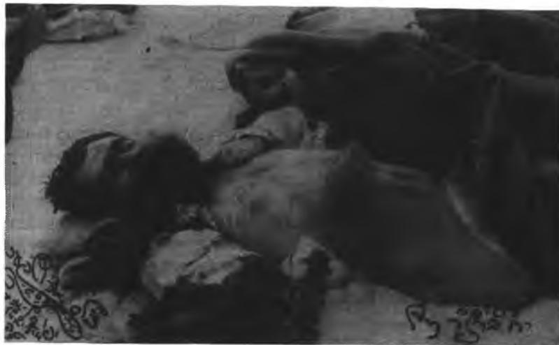
גופתו של יוסף חיים ברנר