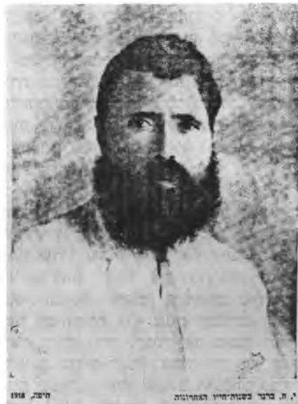
ה. ה. ברנר בשנות-חייו הצעירות

לתוך שתיים או שלוש שורות של קמיע. ללא סימני פיסוק ללא אותיות סופיות ובלי שום מרחק בין התווים. כאילו כל הקמיע חרותה במלה אחת ארוכה. אלא שאין שעה פנויה בידו, כי הוא נמשך בכוח קסמו של האיש ומותו. ובקסמם של הספיקות שהותיר אחריו לאלף שנה ולאף חוקרים. וכבר הוא משתוקק להשתחרר מחרצובות שיר הקינה שנכפה עליו, ממש כמו האיש החולה-הנכפה וחזיונות התעתועים שלו שנכפו עליו, ולשוב אל המרפסת המקורה שלו, להשרות את רגלו הפגועה באמבטיה פושרת מבריאה, ולשוב אל הקריאה המענגת באוצר המובחר המונח בידיו.