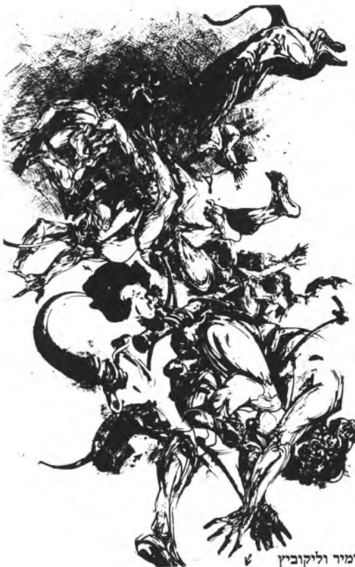
ציור: ולאדימיר וליקוביץ

למחרת הגיע יונאס למדרחוב ברבע לתשע והחל לרשום את דבריה של ורה מיד כשהתחילה לנאום. הוא רשם שנית כאשר חזרה על נאומה וחזר ורשם בכל פעם שדיברה. עד הצהריים היו בידו שש נוסחאות. אחרי הפעם הששית — ורה עזבה בצהריים — נכנס יונאס לבית קפה סמוך והחל עובד, מנסה להכניס סדר ברשימותיו, בורר את המיוחד מתוך המקובל ומנסה לחבר את הווריאציות השונות למשנה אחת. כמה מן הדברים לא הצטרפו יחד. ורה אמרה, למשל, שאילו רצה אלוהים שנפרה ונרבה ונמלא את הארץ, כמו שאמר בברית הישנה, היה ישוע נושא אשה ומוליד ילדים; אלא שהברית הישנה נועדה