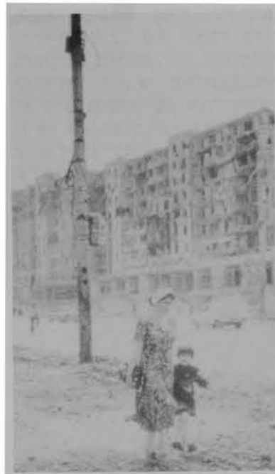
פליטים בחורבות גרוז'ני

רק לאחר התערבותם של אירגונים בינלאומיים לזכויות אדם, זכו האנשים הרדופים הללו למעמד של פליטים