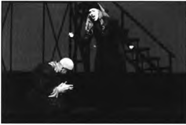
האופרה הישראלית "מסע אל תום האלף" (עמ' 22)