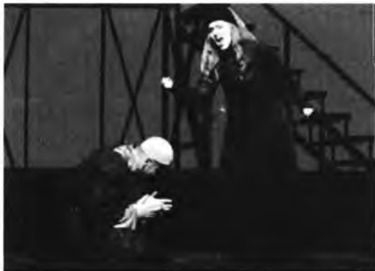
האופרה הישראלית "מסע אל תום האלף"

של קסם ויוזאלי, בו הוא מתאר את המסע המופלא של הסוחר בן עטר ופמלייתו באונייה מצפון אפריקה לארצות אירופה הצפונית. המסע היה מהגוונים הצהובים של המדבר האפריקאי אל הכחול ואפלולית הגוונים הקודרים של היער השחור (Schwarzwald) בו טובעת האשה המנודה. עזר כנגדו של הבמאי המבריק היתה רות דר אשר על התפאורה, שעיצבה באותנטיות מוקפדת תלבושות בסגנון ימי הביניים - החל מהאנפילאות והכומתות המשופדות וכלה בתרבושים ובגלימות. כל התמונות נראו כמיניאטורות מדיאבאליות ואיורים דו-ממדיים.