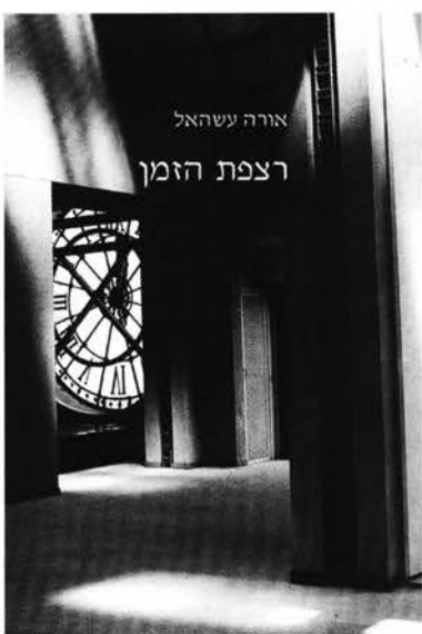
אורה עשהאל רצפת הזמן

לכבוד איגוד כללי של סופרים בישראל, ת.ד. 23033, תל אביב, 61230 מצ"ב המחאה על סך 135 ₪ דמי מנוי ל-3 גיליונות 'תיאטרון', לפקודת איגוד כללי של סופרים בישראל. שם פרטי: _____ שם משפחה: _____ רחוב: _____ מס': _____ עיר: _____ מיקוד: _____ טל: _____ נייד: _____ פקס: _____ כתובת אלקטרונית: _____