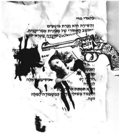
רוני סומק, "והשירה היא נערת-פושעים", עמ' 28